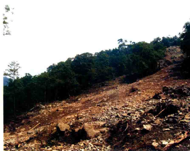
随处可见的山体滑坡