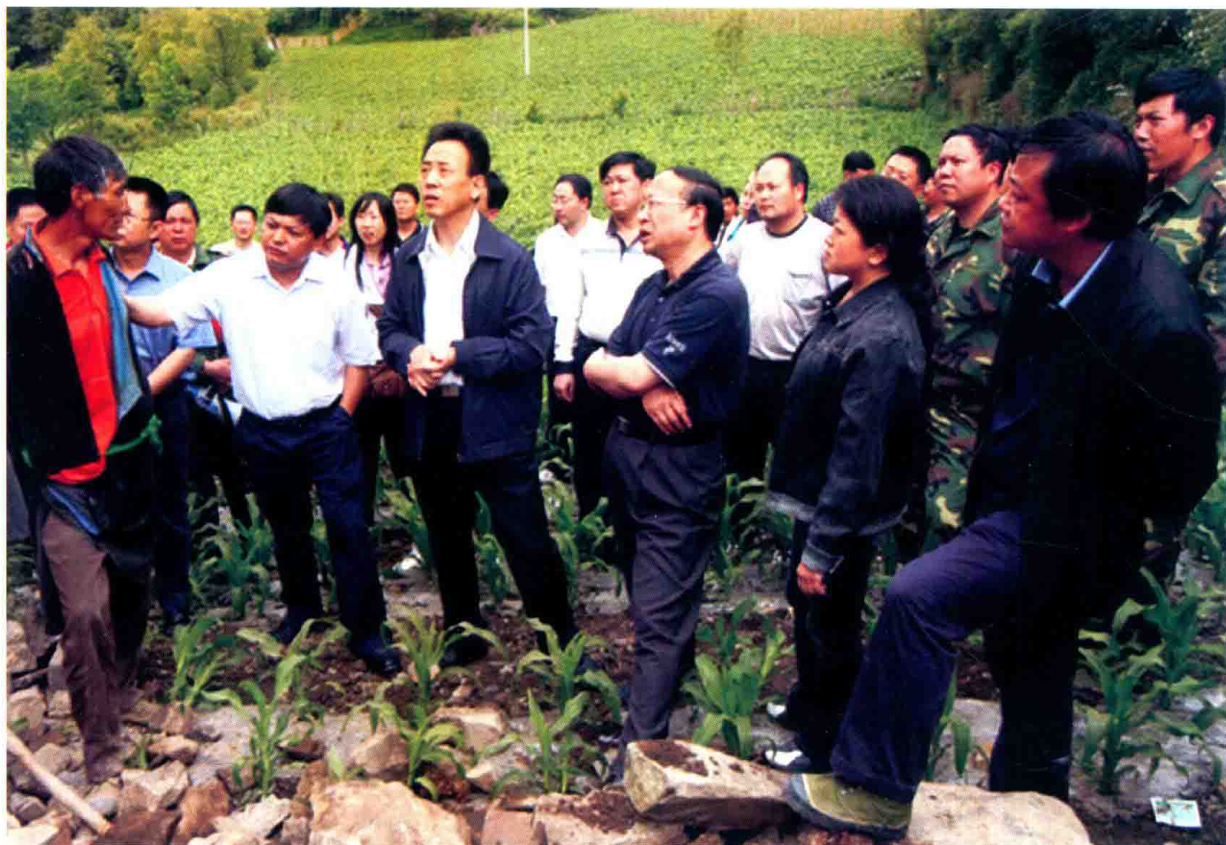
2008年5月27日，县委书记、人大常委会主任姜小林(右二)，县委副书记、县长韩冰(右一)陪同省委常委、常务副省长魏宏(左三)，雅安市委书记、市人大常委会主任徐孟加(右三)，雅安市政协副主席张必达(后排中)在硃碛藏族乡查看地震灾情