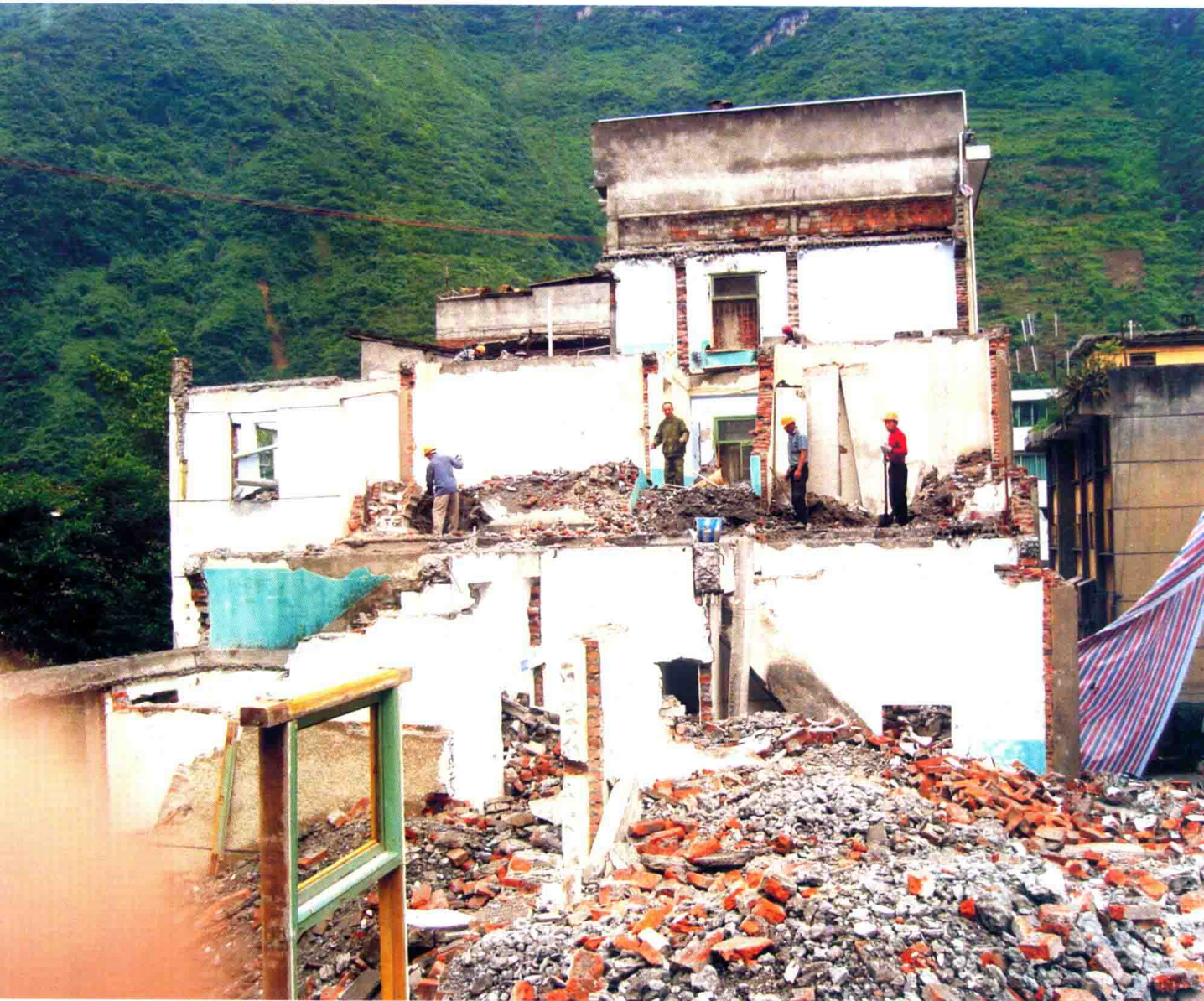
倒塌的县中医院门诊部