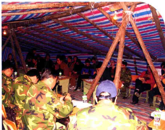
抗震救灾各工作组汇报救灾情况