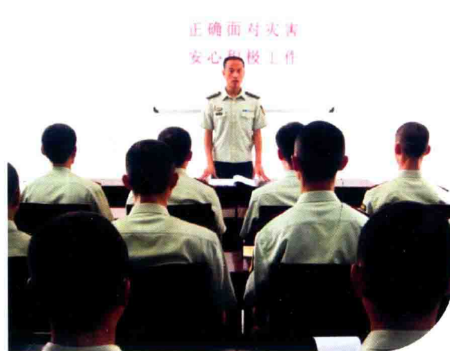
县武警中队开展保一方平安教育