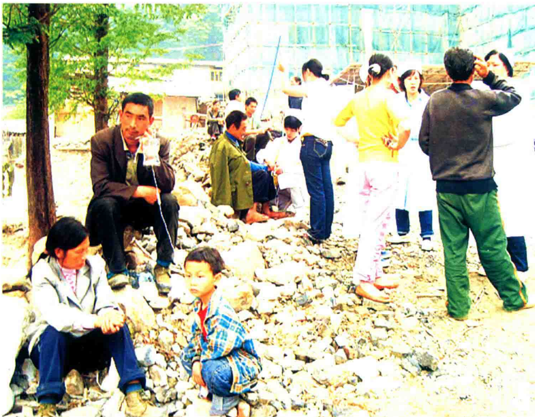
县医院转移住院病人