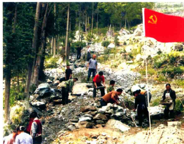
在抗击泥石流的战斗中，党员先锋队充分发挥模范带头作用，带头抗击泥石流