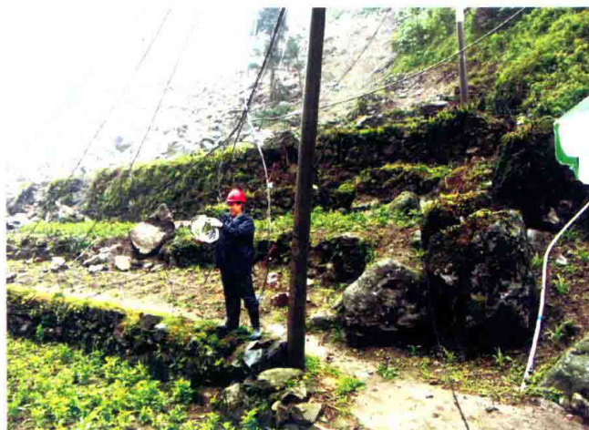
被毁坏的通信设施