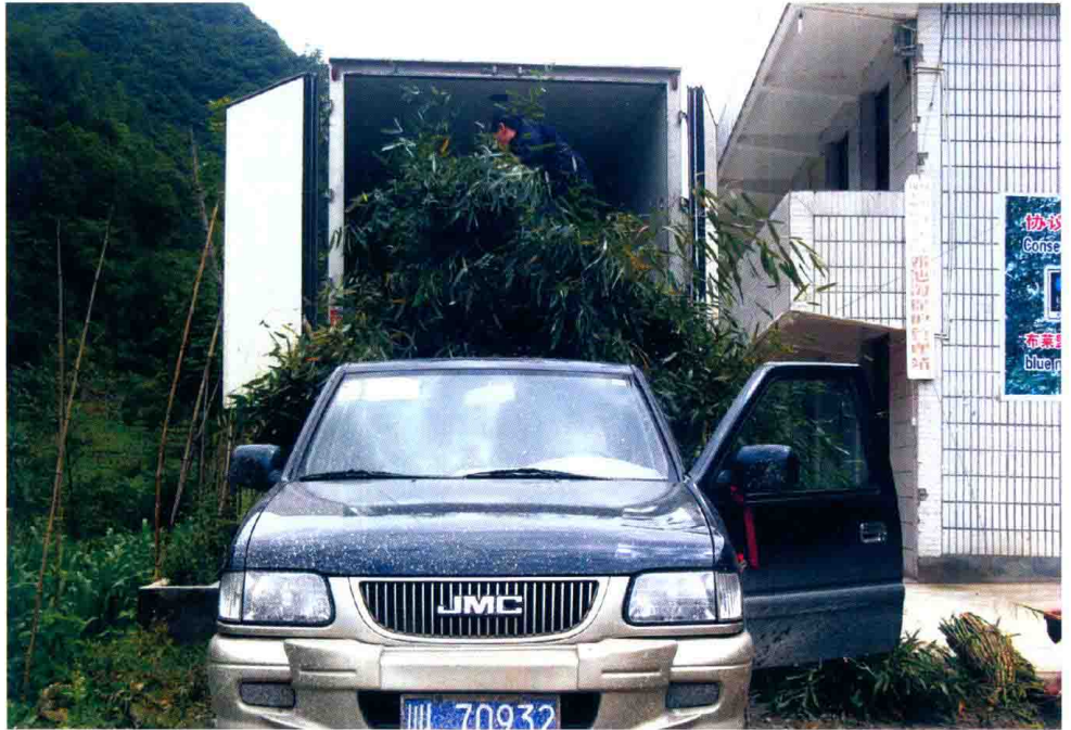
为转移大熊猫作好准备