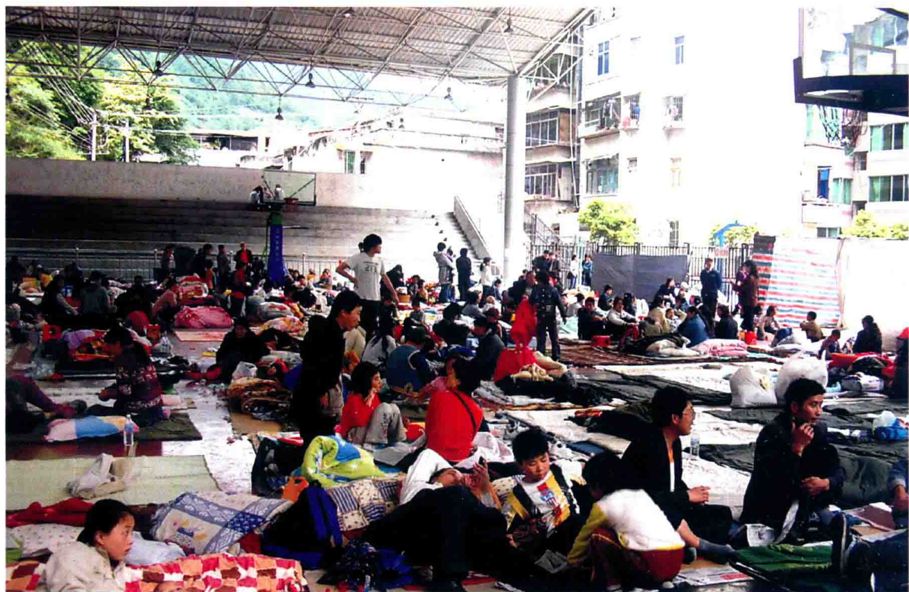
县城受灾群众临时安置点