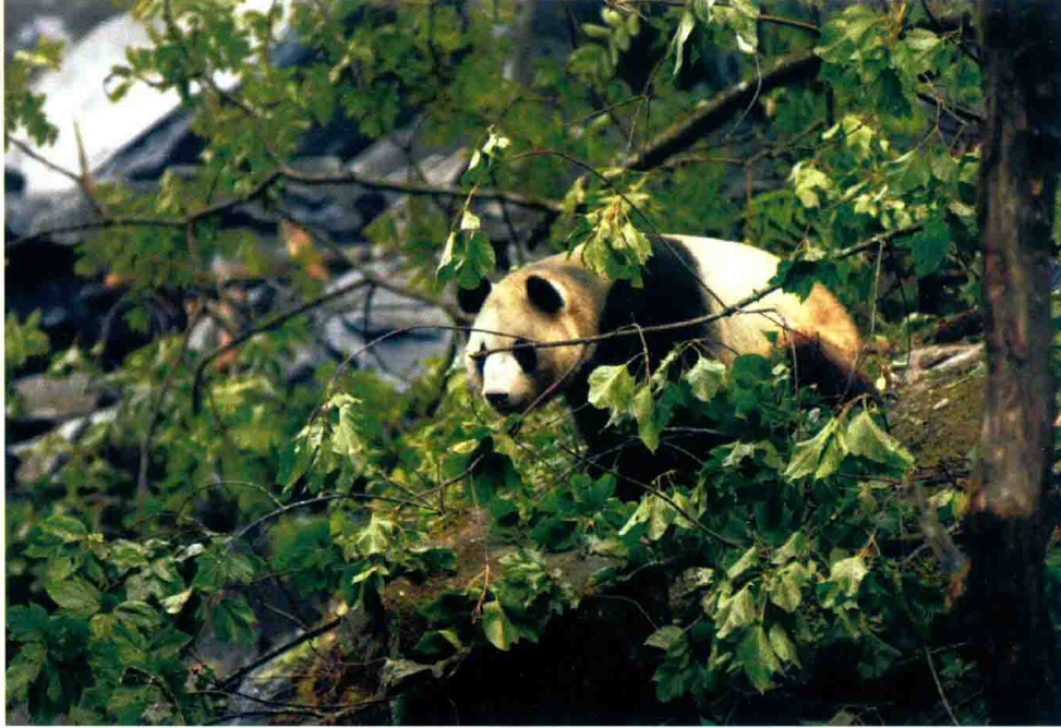
地震后惊恐不安的大熊猫