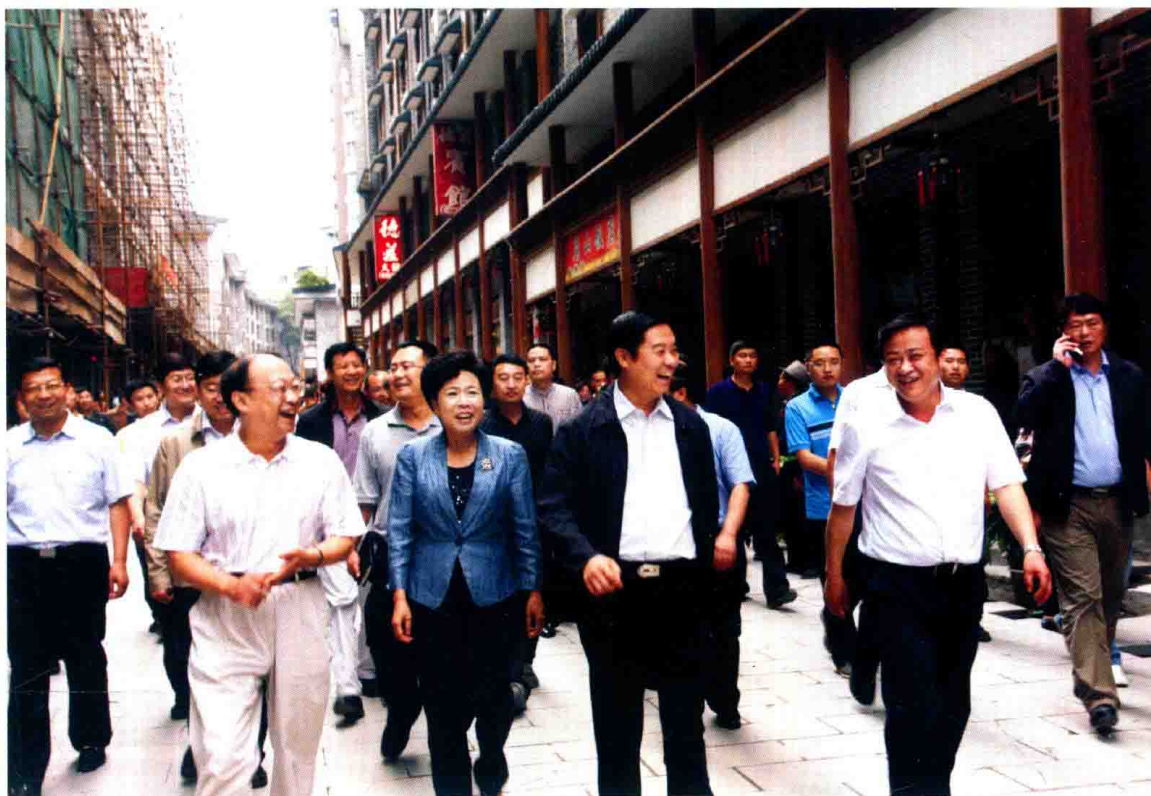
2012年6月5日，省委书记、省人大常委会主任刘奇葆（前右二），副省长黄彦蓉（前左二），市委书记徐孟加（前左一）在县委书记韩冰（前右一）陪同下莅临“熊猫古城”调研