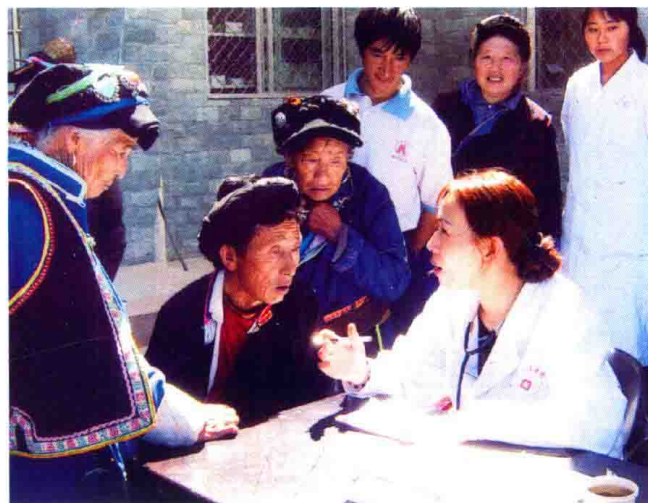
为饶碛藏族同胞开展义诊