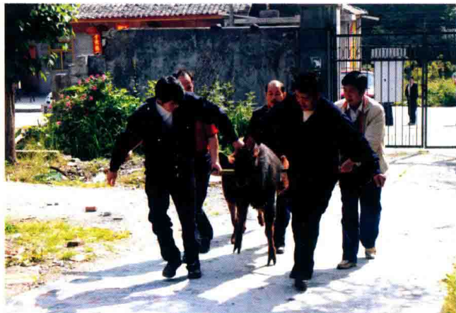
蜂桶寨保护区工作人员在地震后救助野生动物