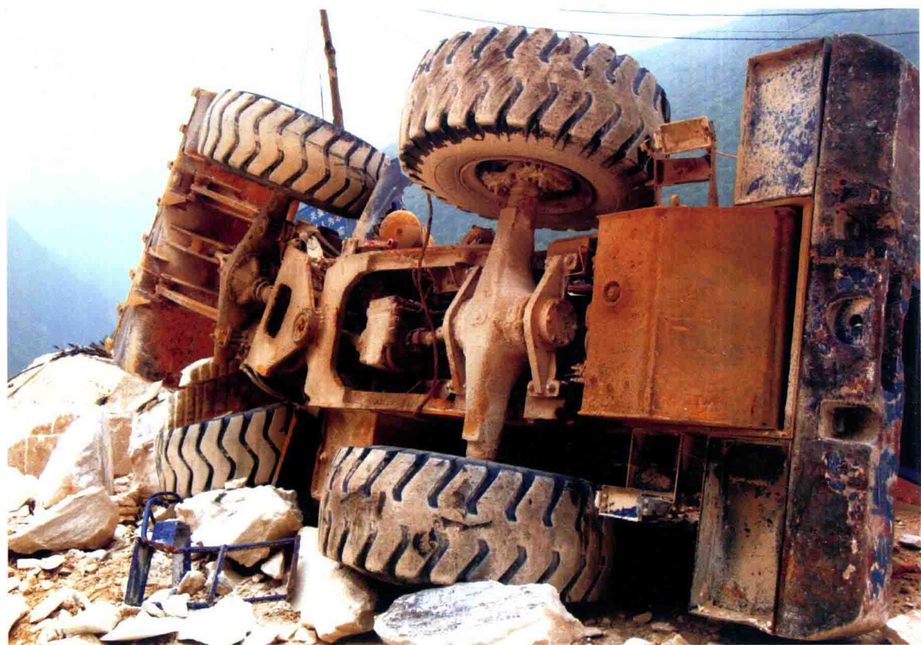
大理石矿山损失严重