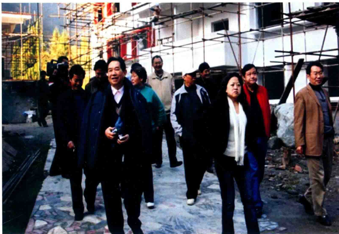
2008年7月19日，中共四川省委原书记谢世杰(前左一)一行到宝兴视察灾后重建工作