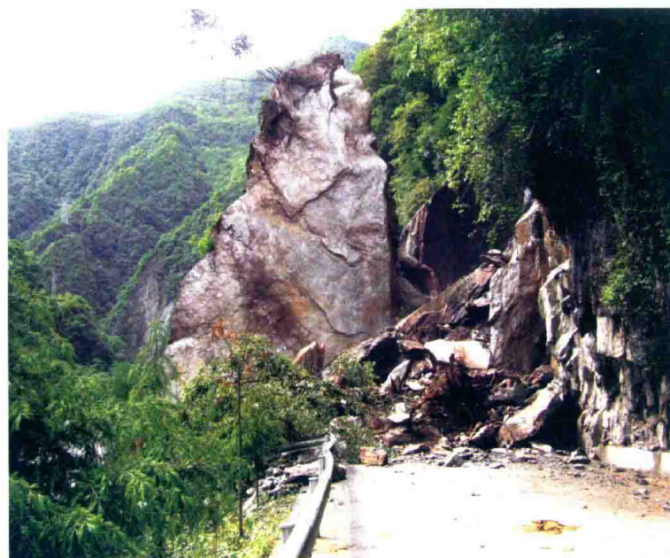
山体崩塌阻断S210公路