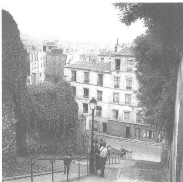
图 1.1 巴黎蒙马特（Montmartre）的阶梯之上，巴黎，20 世纪 50 年代

再次，从埃切勒利的故事中我们也能够看出城市社会关系的强化。20 世纪 50 年代的巴黎并不是简单地包含了不同的历史和地理因素，而是将它们融合在一起，并借此将这种“差异性”融入彼此的关系中去。这种差异性有可能被忽略或者夸大，被遗弃或者被接受。不管怎样，城市通过汇集和夸大这些历史和地理因素而进一步加强了社会关系。这些社会关系同样也是权力关系。它的强化可以加剧社会的紧张程度，比如工人和阿尔及利亚人为了公平而抗争——他们彼此支持或是相互冲突，被其他阶级或民族拥护或者压迫。事实上，城市是无法统驭的。其结果之一便是政府通过分散由于社会关系激