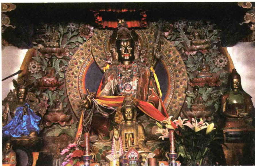
法王如意宝1987年朝礼五台山时亲自督建、装藏、开光，供奉于菩萨顶祖师殿的莲师像。

1987年时的五台山远不像现在这样人来人往、香火鼎盛，那时整座山上见不到多少常住的出家人，很多寺庙都是空的。说起来，现在的人恐怕难以相信。