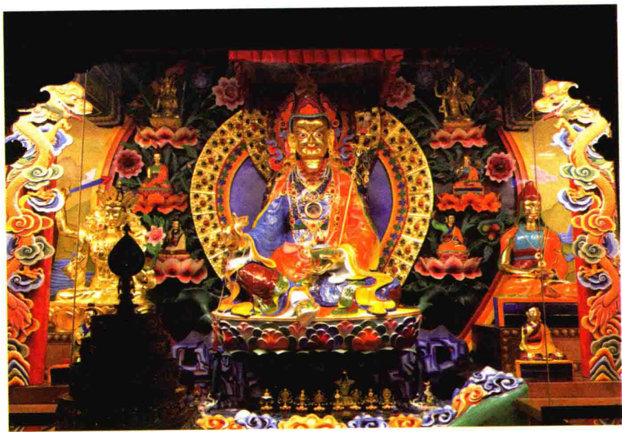
❁ 2016年，历时三年多的佛像保护工程圆满，对包括莲师像在内的菩萨顶祖师殿的十九尊佛像进行了包铜保护。

“首先用全数字信息技术对佛像进行三维扫描。把数据收集储存，进行数据分析，对破损位置进行数据修复。然后运用三维雕刻和三维打印制作佛像等比例模型。再用2毫米厚铜板在模型上锻造一比一的铜材质佛像。最后把2毫米的铜制佛像拆解分块紧密包裹在原有的泥塑佛像外侧。再在铜衣上贴金、彩绘。在不破坏原有泥塑佛像的基础上包裹一层铜，使其更加牢固并能长久保存。”