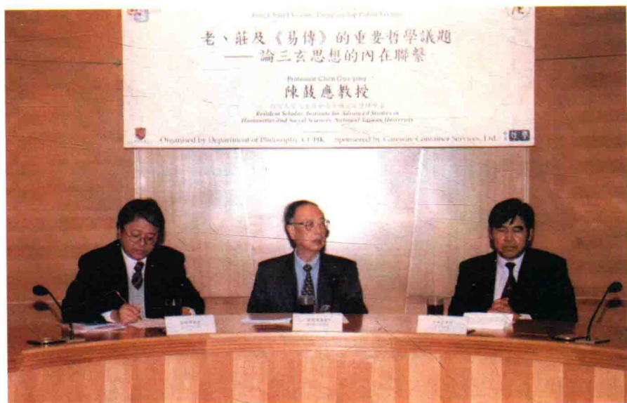
陈鼓应（中）在学术会议上