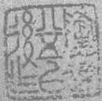
弘宗演教 毓秀鍾靈