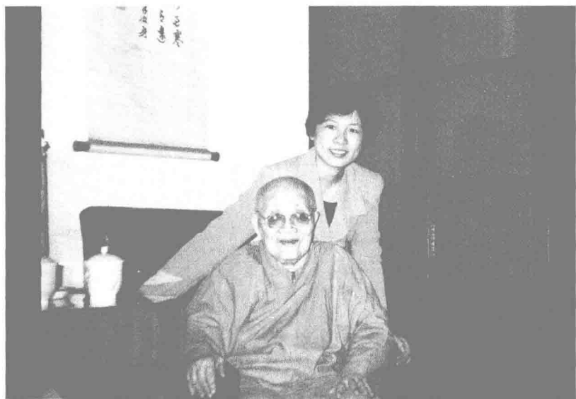
作者与隆莲法师(1992年)