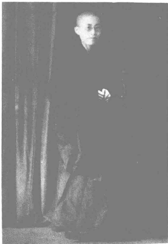
青年时期的隆莲法师