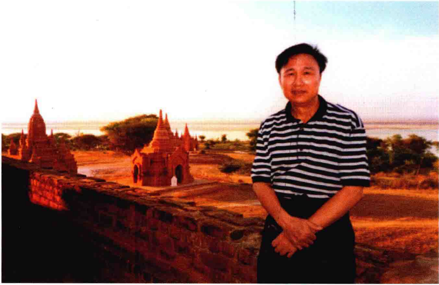
2002年2月摄于缅甸的蒲甘