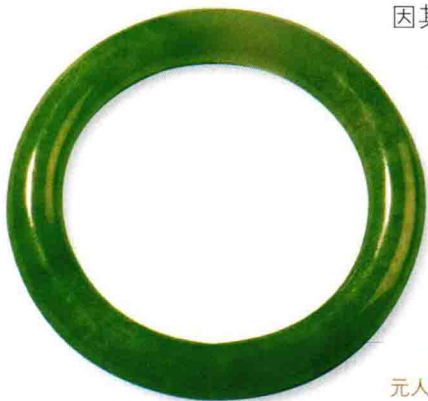
中国嘉德 2000 年 11 月以 52.8 万元人民币拍卖成交的满绿翡翠手镯。