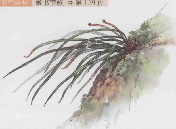
书带蕨科 姬书带蕨 ⇨ 第 139 页