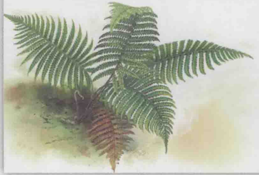
铁角蕨科 南洋巢蕨 ⇨ 第 148 页