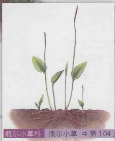
瓶尔小草科 瓶尔小草 ⇨ 第 104 页