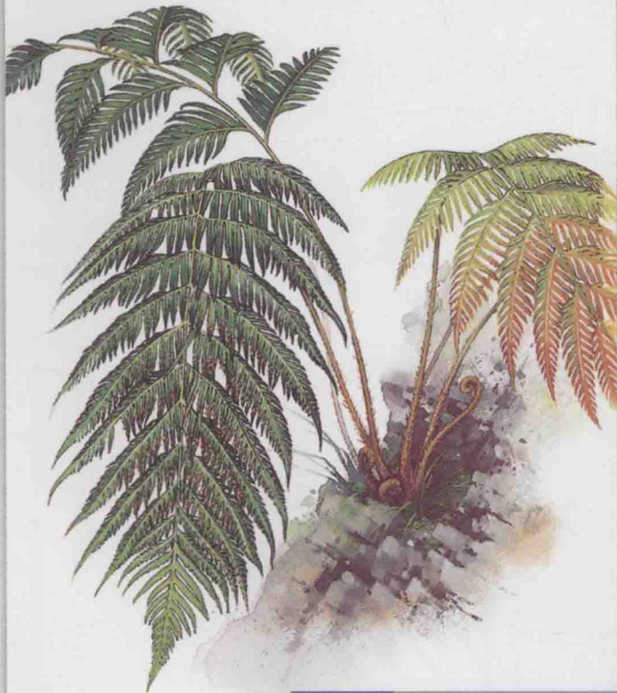
乌毛蕨科 东方狗脊蕨 ⇨ 第 152 页