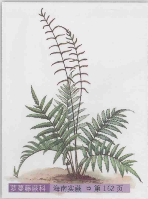
萝蔓藤蕨科 海南实蕨 ⇨ 第 162 页