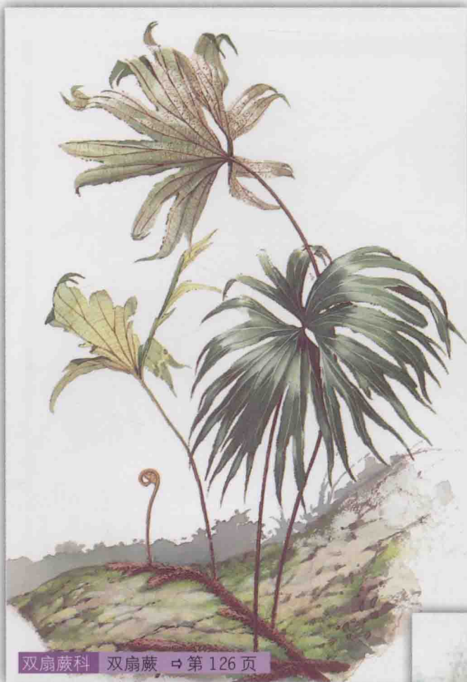
双扇蕨科 双扇蕨 ⇨ 第 126 页