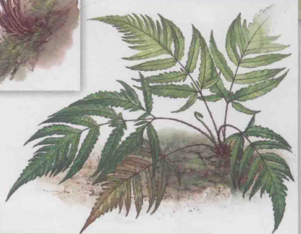
鳞毛蕨科三叉蕨亚科 蛇脉三叉蕨 ⇨ 第 166 页