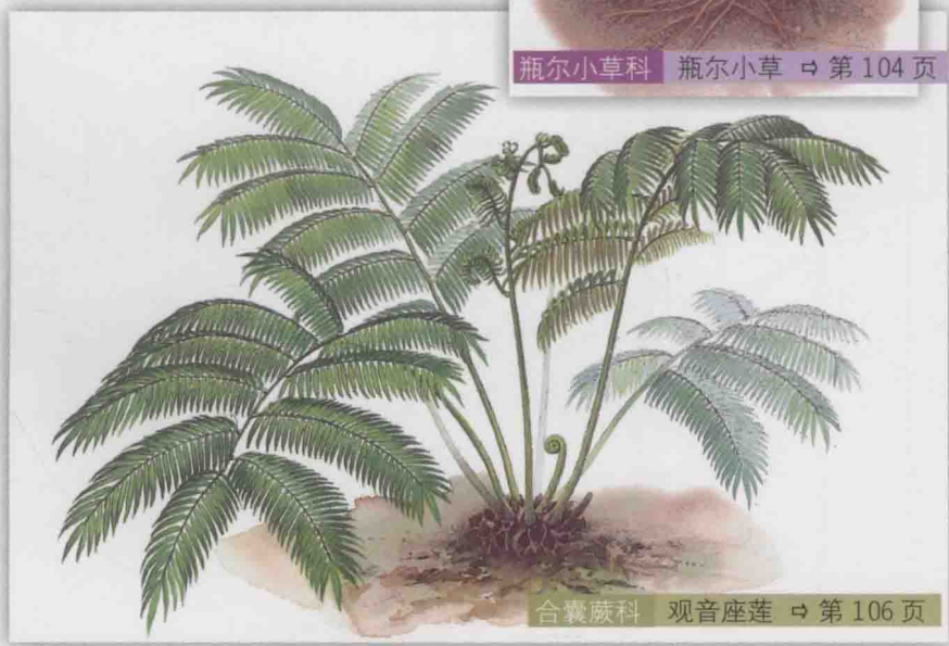
合囊蕨科 观音座莲 ⇨ 第 106 页