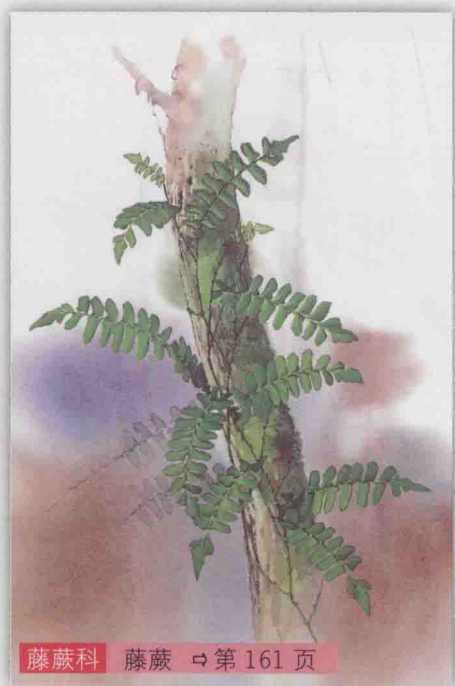
藤蕨科 藤蕨 ⇨ 第 161 页