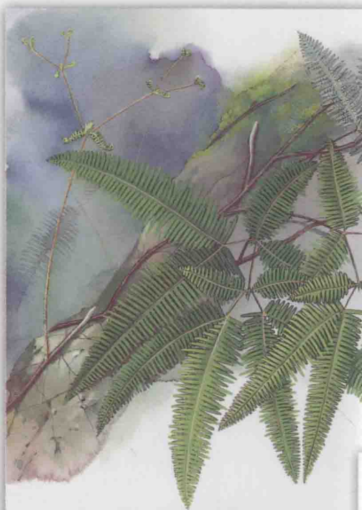
里白科 芒萁 ⇨ 第 114 页