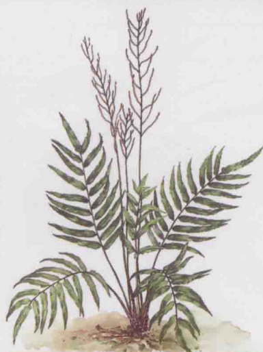
瘤足蕨科 华中瘤足蕨 ⇨ 第 124 页