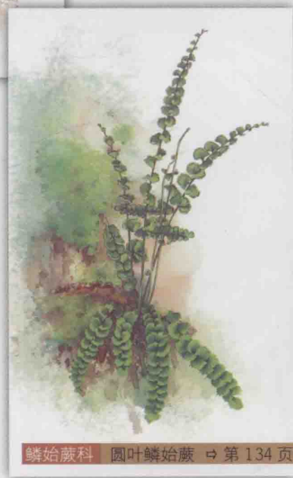
鳞始蕨科 圆叶鳞始蕨 ⇨ 第 134 页