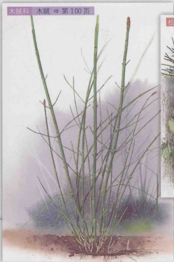
木贼科 木贼 ⇨ 第 100 页