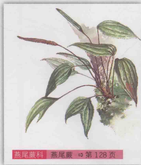
燕尾蕨科 燕尾蕨 ⇨ 第 128 页