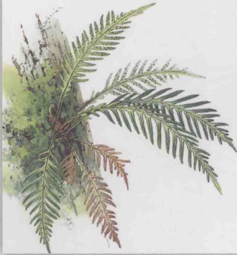
禾叶蕨科 蒿蕨 ⇨ 第 144 页