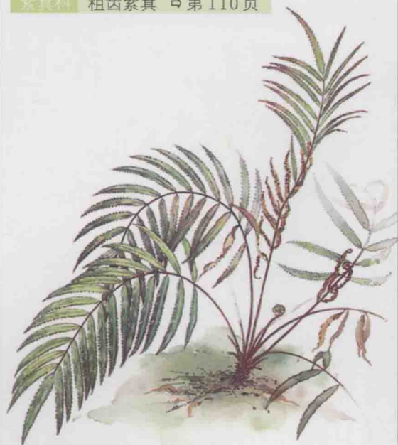
紫萁科 粗齿紫萁 ⇨ 第 110 页