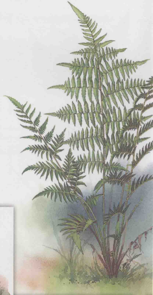
鳞毛蕨科鳞毛蕨亚科 南海鳞毛蕨 ⇨ 第 164 页