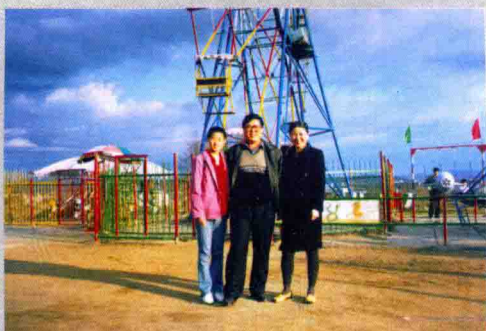
作者与妻子、女儿合影