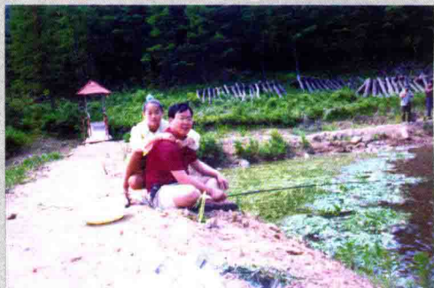
作者与女儿在钓鱼