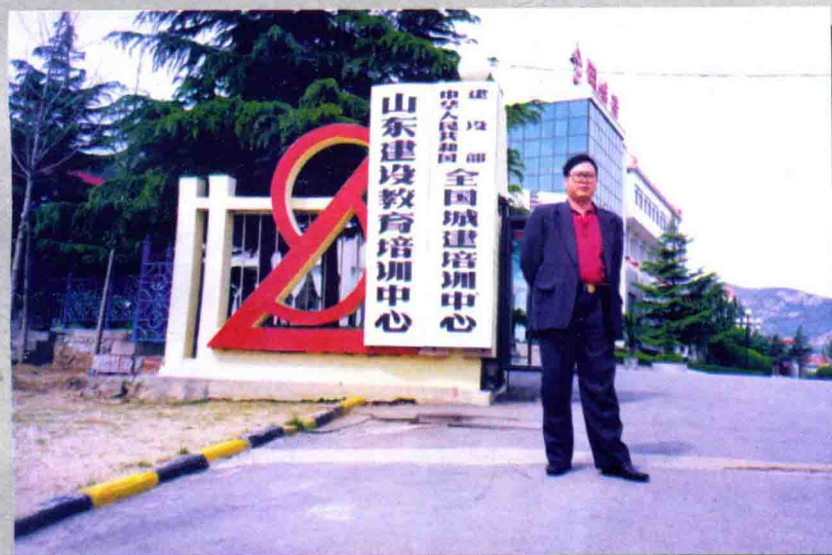
作者在全国城建培训中心