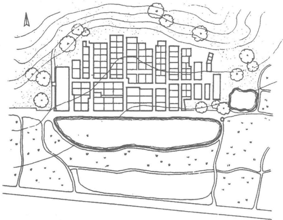
图2-1 梳式布局——广州黄埔区沙浦村总图

在民居中，要取得良好的自然通风效果，首先要有良好的朝向，以便取得引风条件。总体布局的好坏是非常重要的一环。在朝向、引风条件和总体布局都获得良好条件的前提下，住宅内部通风效果将取决于平面布置。广东民居在总体布局中主要采取梳式布局（图2-1）和密集式布局（图2-2）两种方式。在平面布置中采取