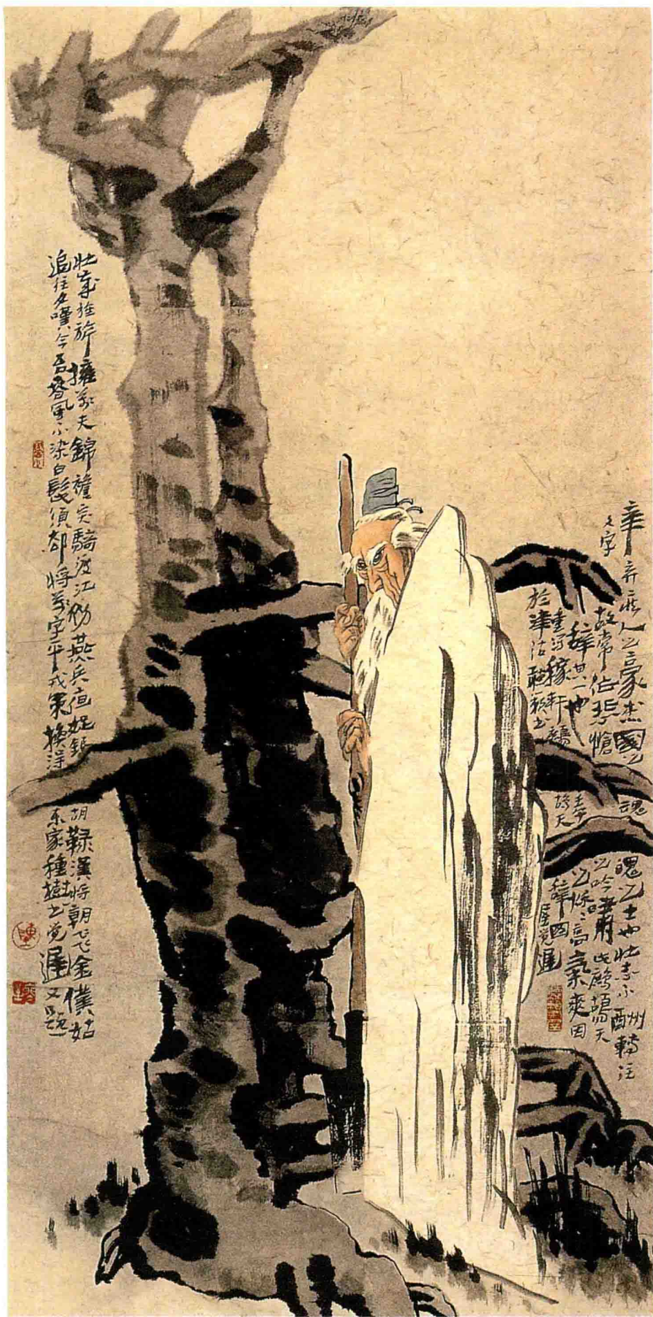
辛弃疾·鹧鸪天词意