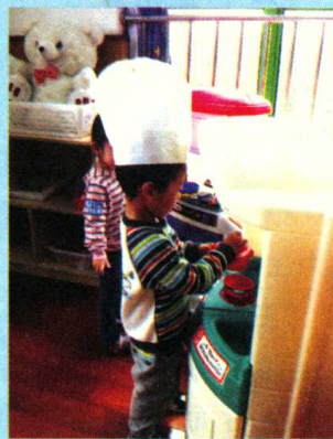
图 1-7 n 和 l 的误解

分析： 标准普通话涉及声母、韵母、声调等多个部分，案例中的小林在声母的发音上，混淆了 n 和 l，造成了小朋友的误解。