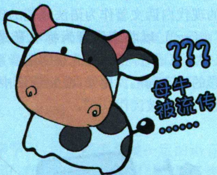
图 1-3 母牛被流传

分析： 案例一中的误会是因为语音方面的问题而产生的，当地方言“肉”音“yòu”；案例二中的误会是因为词汇方面的问题而产生的，当地“爷”就是我们普通话的“爸爸”，“爹”就是“爷爷”；案例三中的这句话简化句子成分后，就是“母牛被流传”，属于语法错误。语音、词汇和语法是构成语言的基本要素，任何一个要素出现错误，都可能造成交流障碍。