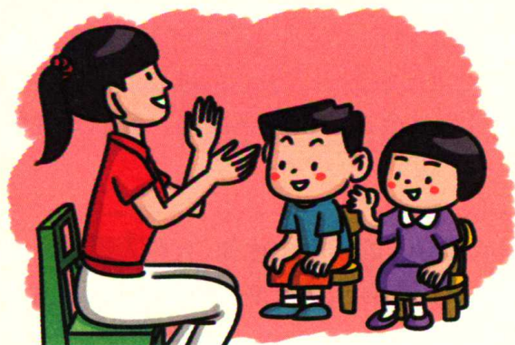
图 1-4 普通话是幼儿教师的职业语言

幼儿教师的语言对于幼儿语言发展也有着重要影响。幼儿的语言发展大部分是通过自然观察和模仿完成的，幼儿教师的语言无疑是幼儿模仿的对象和学习的典范。幼儿教师的语言客观上具有很强的示范性，只有良好的语言示范才能对幼儿语言发展、良好语言习惯的形成起到积极的促进作用。