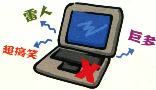
图 1-5 摒弃不规范的用语

这里的“北方”不是地理意义上的“北方”,而是方言分区意义上的“北方”,大致包括我国的东北地区、华北地区、西北地区、西南地区和江淮地区。北方方言即一般以北方方言中比较通行的词语为标准,舍弃北方方言中过于土俗的词语。之所以把北方方言作为基础方言,一是因为使用北方方言的人口占汉族总人口的3/4,二是因为北方方言的词汇系统在各地的差异相对较小。