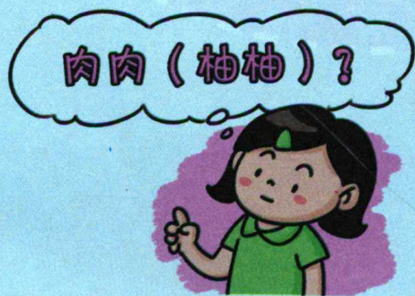
图 1-1 肉肉和柚柚

一日,小张带着刚出生不久的儿子回家乡,邻居问:“孩子叫什么?”小张说:“叫柚柚。”邻居纳闷,孩子不胖,怎么起个“肉肉”的小名儿。