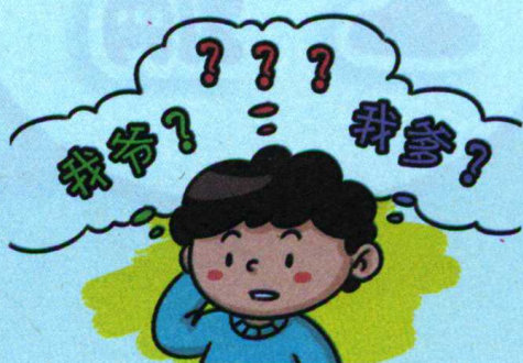
图 1-2 我爷和我爹