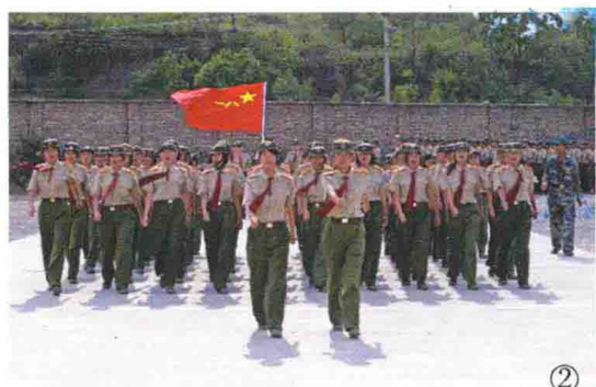
②③④⑤学院军训成果汇报。