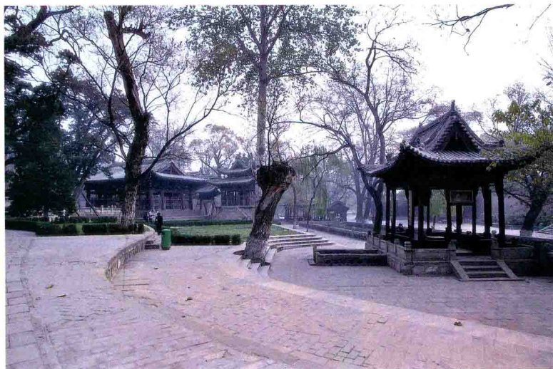
图1-2 晋祠内全景/上图

晋祠占地4万多平方米，祠内古木荫翳，自宋迄清，历代所建殿、堂、楼、阁、亭、台、桥、树百余座，是一处有重要历史、艺术、科学价值的古建园林，享誉海内外。