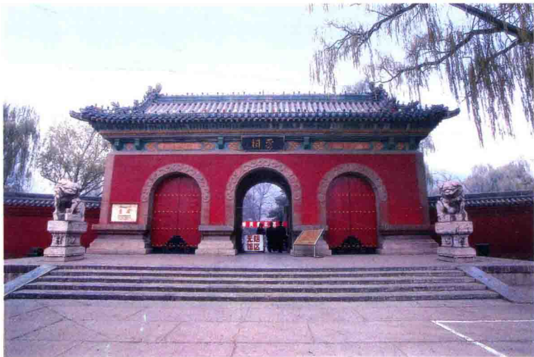
图1-1 晋祠大门 在晋祠中部中轴线东端，是晋祠的正门。正门建于台基之上，由三个券门组成。朱红色墙体，前置石狮一对，外观端庄古朴。

我们现在虽然无法肯定晋祠始创的确凿年代，但北魏著名地理学家郦道元在他的《水经注》一书中已赫然载有对晋祠的描述：“悬瓮之山，晋水出焉，昔智伯遏晋水以灌晋阳。其川上溯，后人踵其迹，蓄以为沼。沼西际山