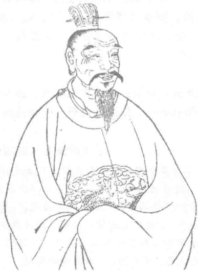
班超像，图出自清·顾沅辑《古圣贤像传略》。