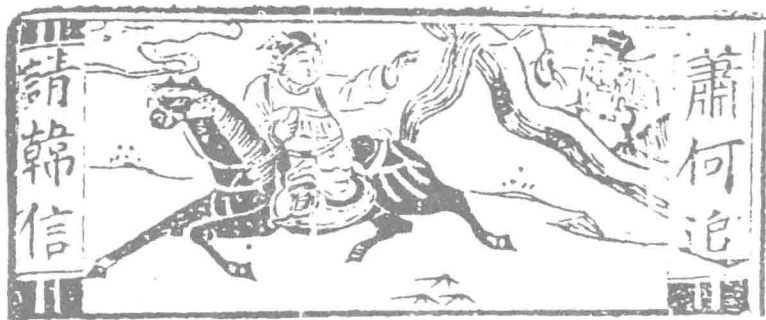
《两汉开国中兴 传志》版画之萧何追 请韩信图

耳，此乃信所以去也。王必欲拜之，择良日，斋戒，设坛场 ① ，具礼，乃可耳。”王许之。诸将皆喜，人人各自以为得为大将。王拜大将，乃韩信也，一军皆惊。