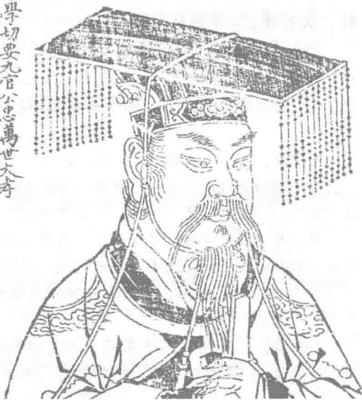
帝舜像，图出自明·天然撰《历代古人像传》。