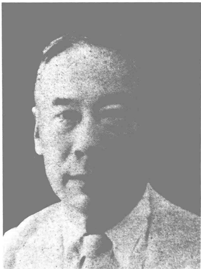
李建勛 (1884 — 1976)