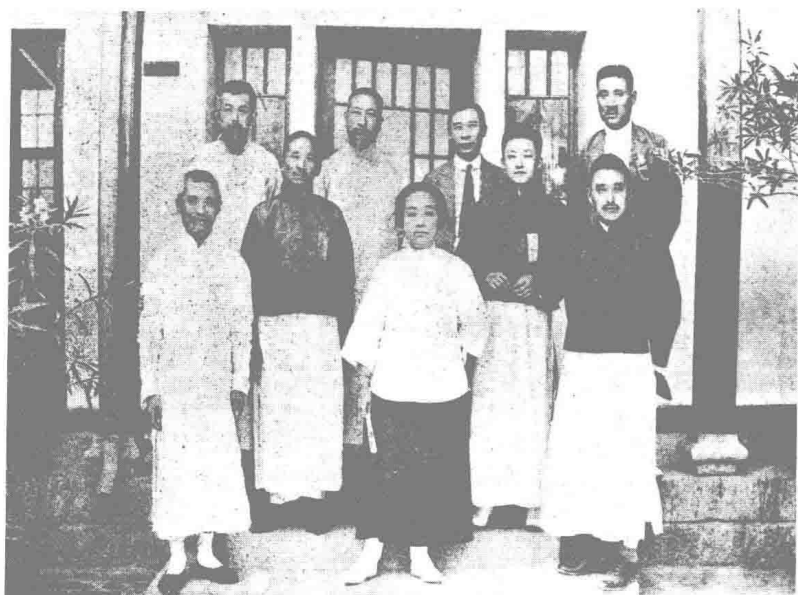
李建勋（后排右二）与蔡元培（中排左）、梁启超（中排右）、黄炎培（前排右一）、张伯苓（后排右一）、熊希龄（后排左二）、朱其慧（前排中）等合影（1922年7月）。