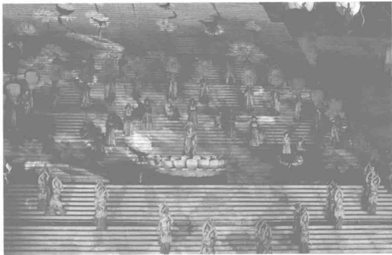
中华泰山封禅大典

崇拜自然山水神，是人类发展过程中的普遍现象，例如天子祭名山大川，封禅泰山，则是中国名山大川发展史上的特有现象。封禅是古代帝王祭祀天地的一种礼仪活动。封，是帝王到泰山顶上祭