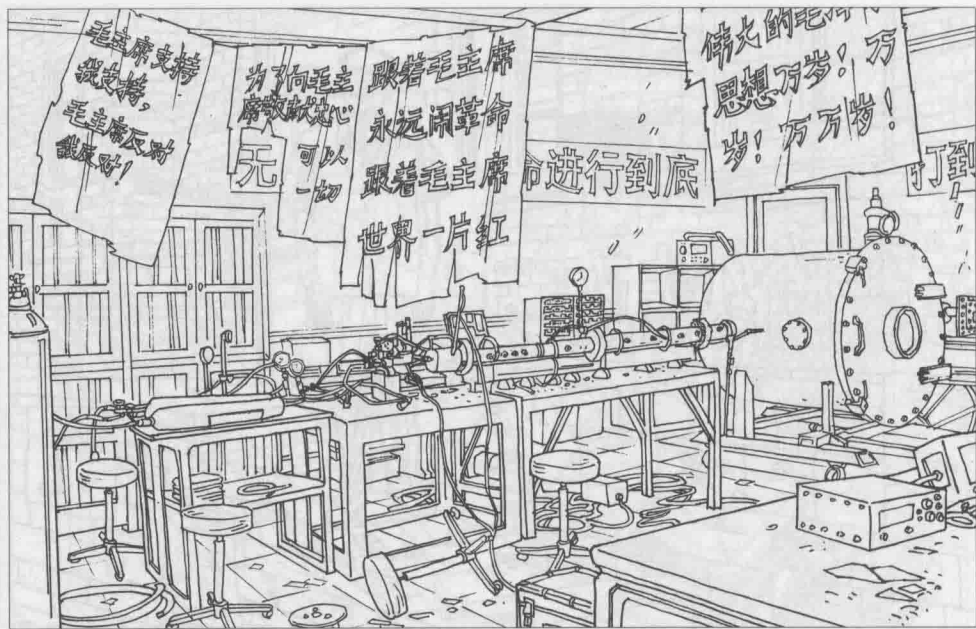
6 直属中科院的研究基地和实验室设备残损破烂, 科技资料和标本散落遗失, 科研单位竟无人搞科研。