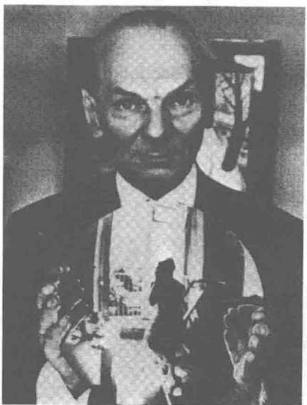
导演尼古拉·阿基莫夫。他的争议性作品《哈姆莱特》由肖斯塔科维奇作曲。照片摄于1932年。