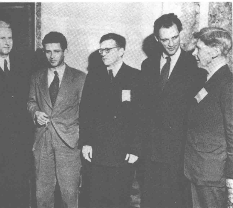
1944年，肖斯塔科维奇在斯大林的压力下，来到纽约参加文化与科学保卫世界和平会议。他对此行，特别是对美国记者的紧盯不放留下了很不愉快的印象。左起：苏联代表团的政治领导、作家法捷耶夫，诺尔曼·梅勒，肖斯塔科维奇，作家阿瑟·米勒，英国威廉·奥拉夫·斯塔帕顿博士。