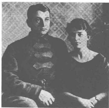
肖斯塔科维奇的赞助人米哈伊尔·图哈切夫斯基元帅和他的妻子尼娜。在苏联肃反时被杀害。