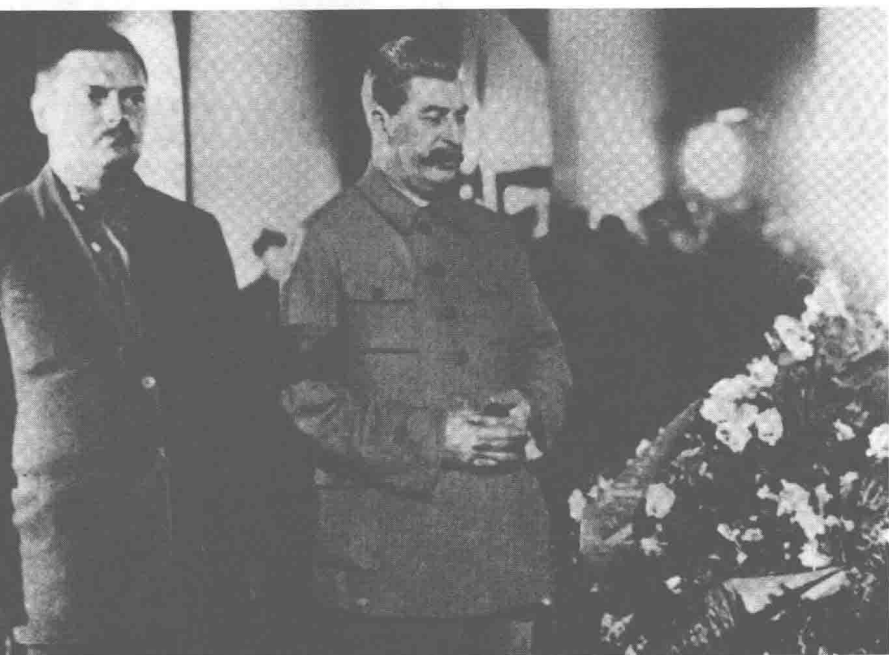
一张罕见的照片：斯大林站在被谋杀的列宁格勒政党领袖谢尔盖·基洛夫的棺槨面前。斯大林身旁是安德烈·日丹诺夫，后来成为苏联共产党文化事务方面的思想领袖。很多年里，他们的喜好决定了官方对待肖斯塔科维奇音乐的态度。照片摄于列宁格勒，1934年。