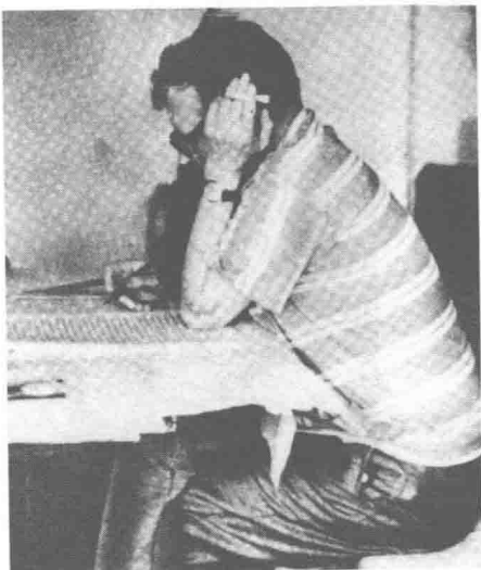
肖斯塔科维奇在工作。他作曲时不需要任何特殊条件，甚至吵闹声也干扰不了他。