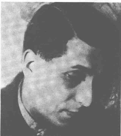
擅长讽刺的作家米哈伊尔·左琴科是肖斯塔科维奇的 朋友。1946年，安德烈·日丹诺夫说他是一头“惹人嫌的、贪得无厌的动物”。