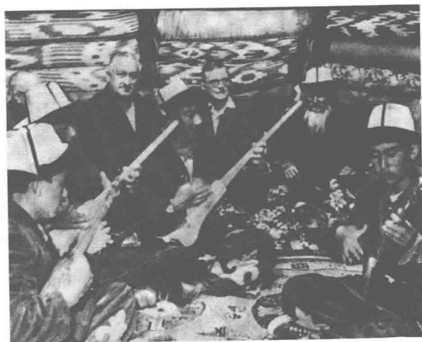
1963年在吉尔吉斯共和国听民间艺术演奏。肖斯塔科维奇的左边是作曲家穆拉戴利，他在俄国乐坛出名始自1948年他与肖斯塔科维奇一起被指责为形式主义者。