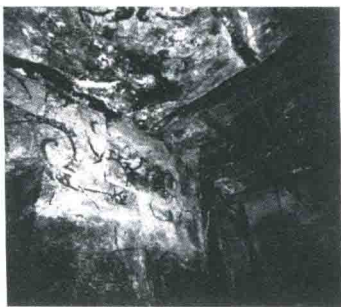
廣州西漢南越王趙昧墓壁畫卷雲紋

漢墓壁畫的發現，始於二十世紀二十年代初。那時，號稱「九朝古都」的河南洛陽，盜墓之風甚為猖獗。傳為洛陽「八里臺」的一組空心磚壁畫，就是在這樣的社會背景下出土的〔五〕。其精美的人物圖像，名震遐邇，此乃西漢墓室壁畫的首次發現。一九三二年，遼寧金縣營城子壁畫墓的發現，揭開了人們瞭解東漢墓室壁畫的序幕。四十年代，在遼寧遼陽市郊，又有東漢晚期壁畫墓的相繼發現。然而，漢墓壁畫更多、更重要的發現，是在新中國成立之後。迄今，見諸正式報道的達三十餘座；分佈地區由過去已知的河南、遼寧兩省，擴大到廣東、河北、山東、江蘇、山西、內蒙古、陝西、甘肅等省區。廣州南越王墓發現朱墨彩繪卷雲紋壁畫〔六〕，填補了西漢前期壁畫遺跡的空白。