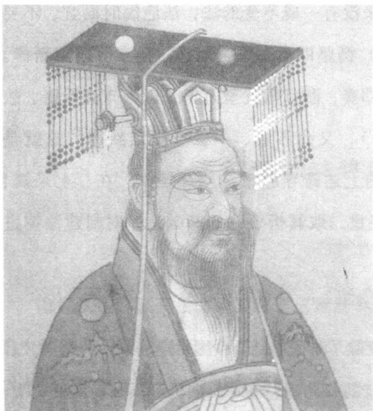
隋朝开国皇帝隋文帝杨坚

铜数：“笞十者铜一斤，加至杖百则十斤。徒一年赎铜二十斤，每等则加铜十斤，三年则六十斤矣。流一千里赎铜八十斤，每等则加铜十斤，二千里则百斤矣。二死（即绞、斩）皆赎铜百二十斤。”所谓“官当”，即以官品抵应受之刑罚。“犯私罪以官当徒者，五品以上，一官当徒二年，九品以上一官