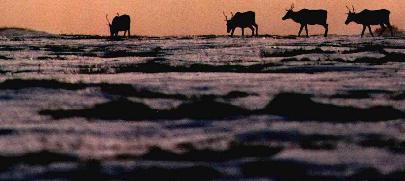
在透着微光的极昼中默默前行的北美驯鹿。