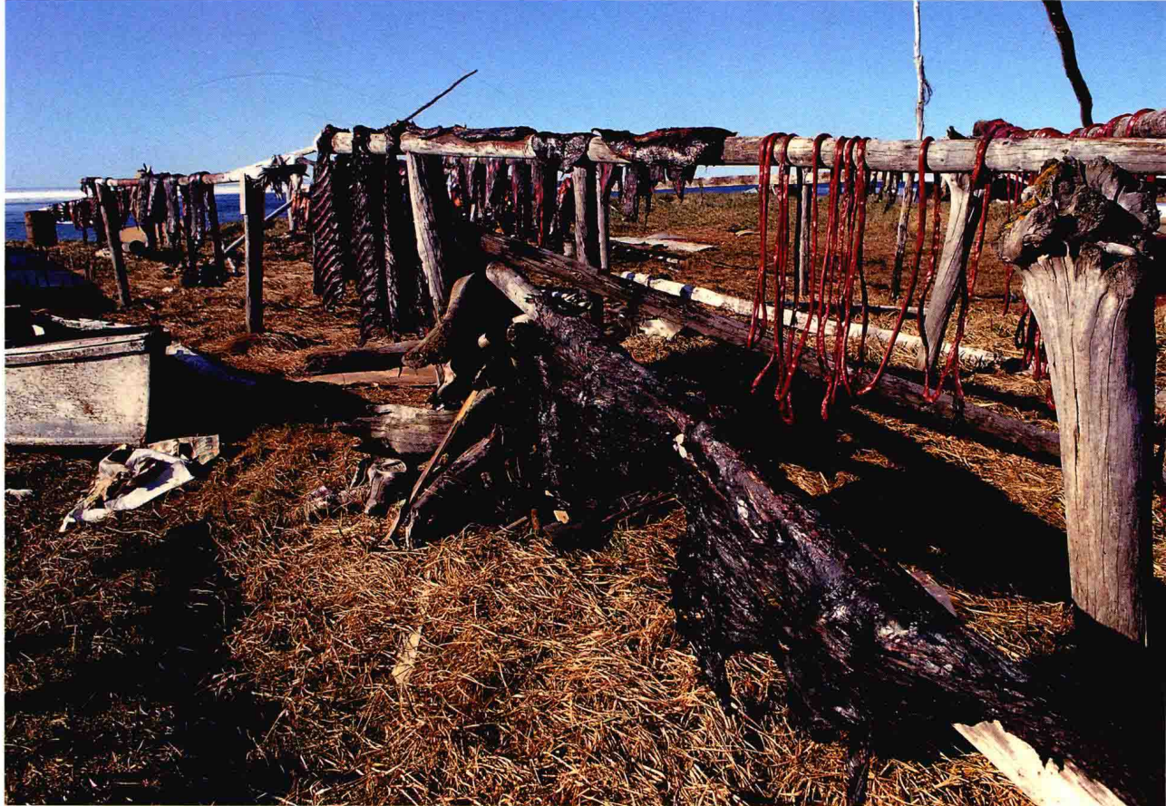
这里海洋资源丰富，可以在海里捕捞到各种食物。海豹的肉不仅可以食用，毛皮还能做成衣服，用途广泛。

现在回想起来，当年我只有十六岁，或许正因为年轻，才能兵来将挡、水来土掩，丝毫不以为苦。话说回来，持续追逐并实现长久以来的梦想，也让我拥有无可取代的珍贵收获。