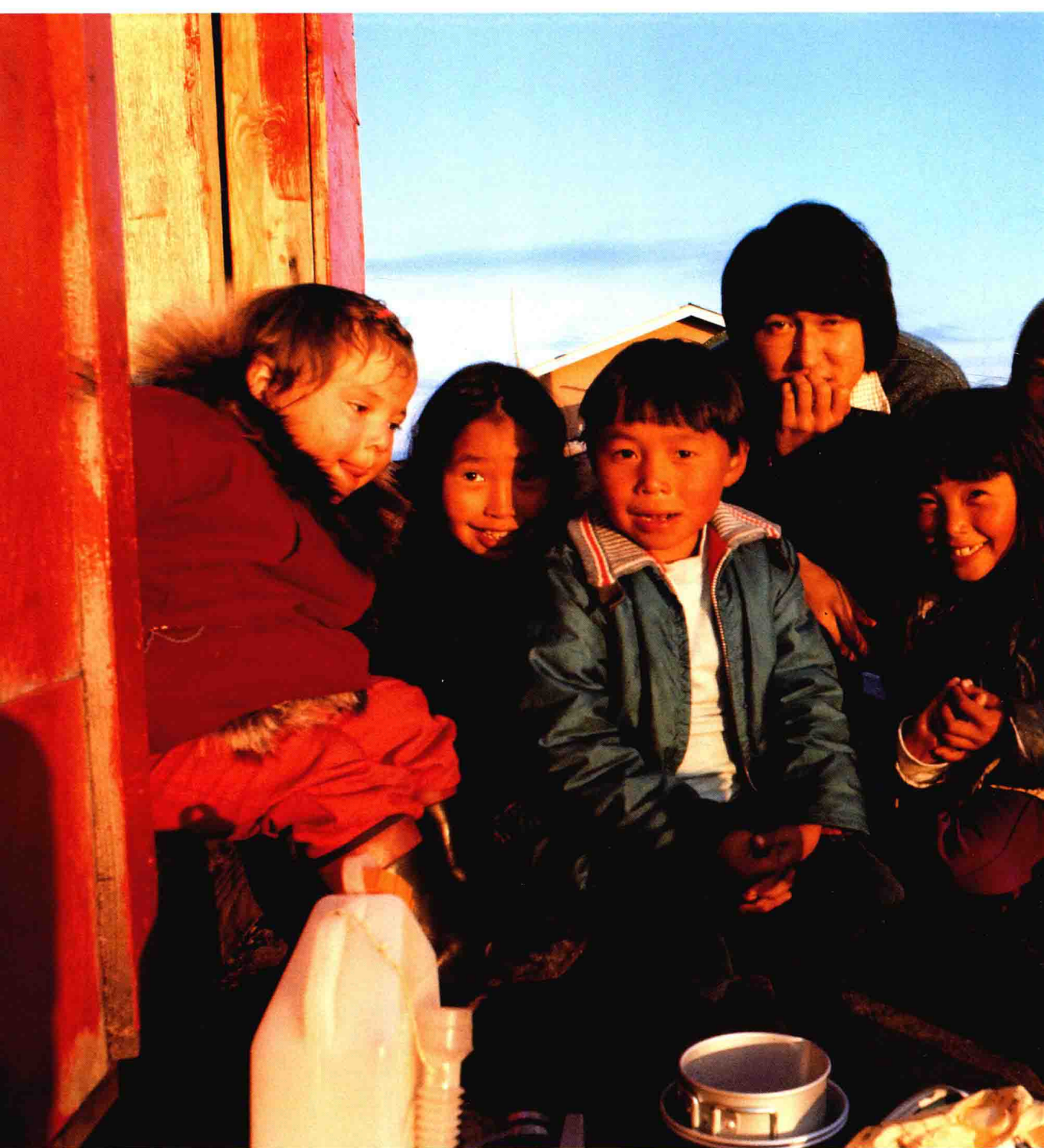
与希什马廖夫村的孩子们合影。每天傍晚在海边散步时，孩子们都会群聚在我身边，跟我一起玩耍。