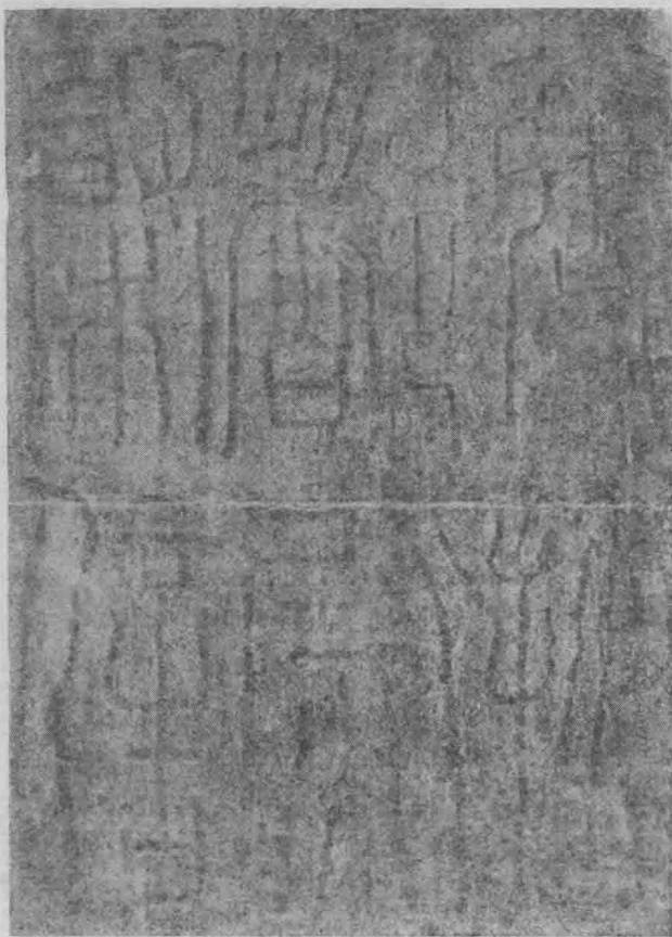
图三 汉代荣信 篆体而有方折

体，又把“徒隶”解释为“奴隶”或“下级官吏”，其实是不正确的。隶是指罪犯，隶书是指施于罪犯的书体，这一点最近鲁国尧同志有所论述，节录如下，供参证。