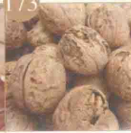
大河家鸡蛋皮核桃