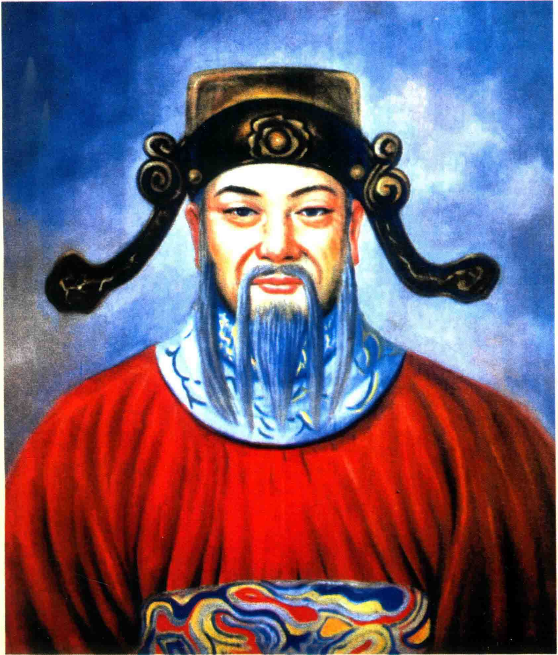
肇 姓 祖 高 僖