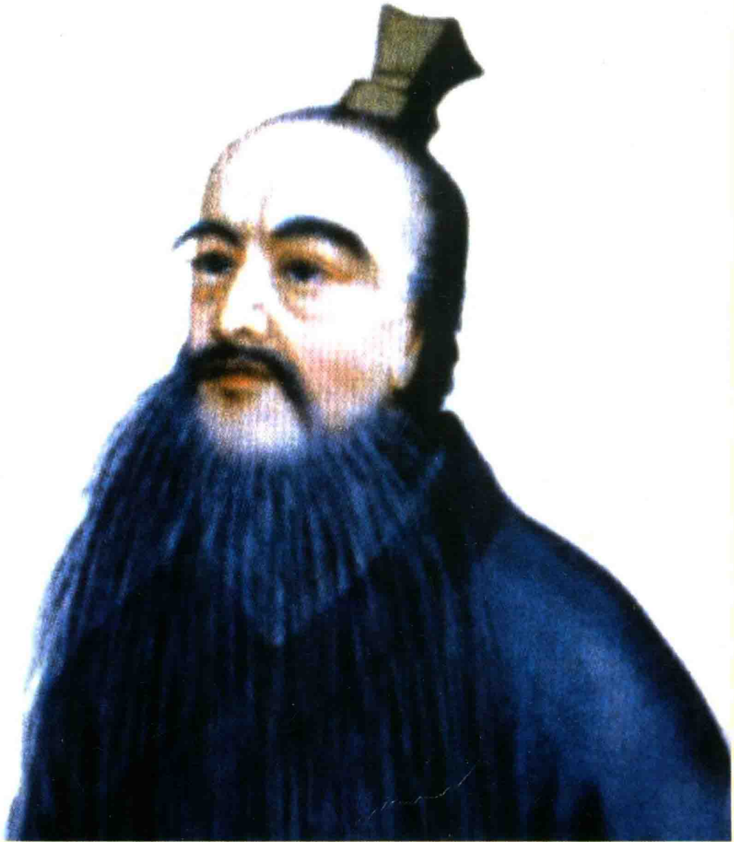
开 姓 祖 卢 敖