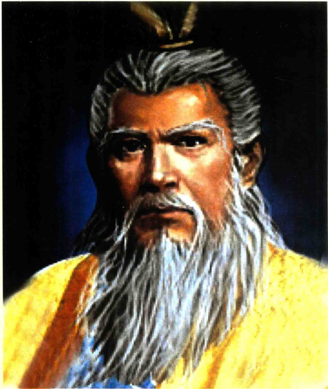
先 祖 姜 太 公