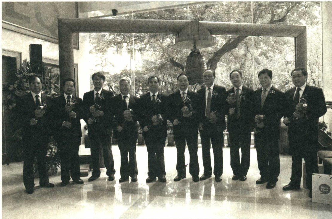
钟声敲响历史性一刻，“特别传媒”作为华文期刊第一股隆重上市