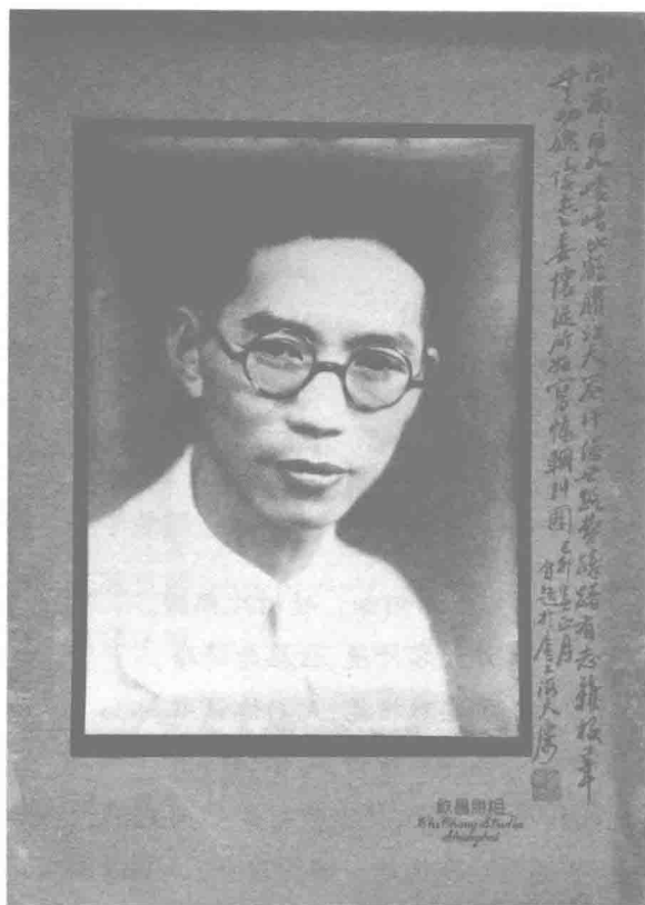
吴荪之 1939 年像

的同龄人,他经历了极不平凡的时代风潮,他的艺术人生也随着时代风云的激变而起伏。最为不幸的是,吴荪之暮年遭遇了“文革”,通往艺术最高峰的道路被无情地摧毁了。当“文革”结束,艺术曙光再次闪现在中国画坛时,他却带着深深的遗憾撒手人寰。