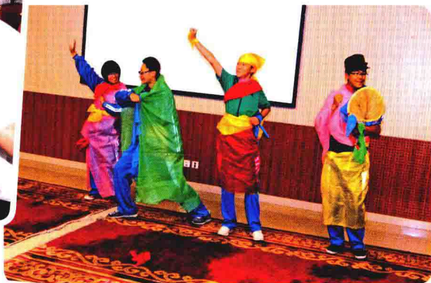
自制民族服装及展示