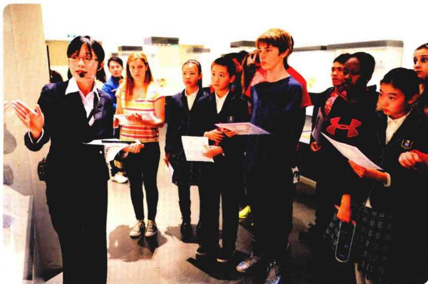
国博社教部的老师在展厅讲授“说文解字”课程

(1) 稻纹陶钵：出土于浙江河姆渡遗址，距今7000多年。陶器外壁刻有一束沉甸甸的水稻稻穗。稻穗图案的出现，证明7000多年前生活在长江流域的河姆渡人已经学会了种植水稻。水稻的形象和农田里的水稻一模一样，说明祖先们看到什么事物，就直接描绘下来，还没有对图案重新