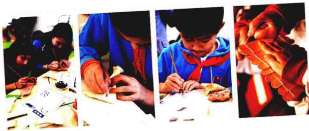
学生体验在陶片、牛骨、木简上刻写古文

展厅学习之后，老师带领学生来到国家博物馆教育体验区的教室，进行在体验区的学习活动，在学校教师的恰当引导下，以课堂展示、互动分享等方式，使学生超越原有认知，达到下一个发展阶段水平。进一步认知汉字发展变化规律：从简单认知逐步走向统一，由最初仅是“直接把看到的物体画下来”的记录生活的方式，逐步发展到“简化、规范的汉字”；最后在体验区的活动中，孩子们运用不同书写工具，在不同书写材料上尝试写下了不同时期的汉字，切身感受到了汉字演变背后的原因以及汉字所包含的文化底蕴。