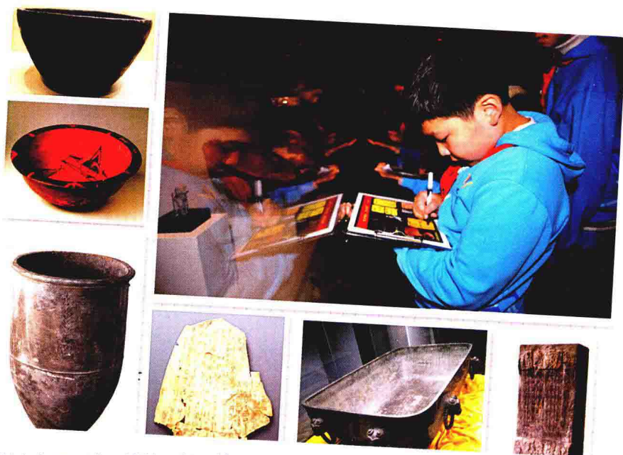
学生在展厅学习并填写学习单

(5) 虢季子白青铜盘：清道光年间出土于陕西宝鸡，铸造于西周宣王时期。铜盘底部铸有金文 8 行 111 字，记载了西周时期的一次历史事件，周宣王命虢季子白讨伐少数民族部落——狁狁，结果大获全胜，杀死 500 名敌人，活捉 50 名俘虏，战后周宣王举行隆重的庆典，表彰虢季子白的功