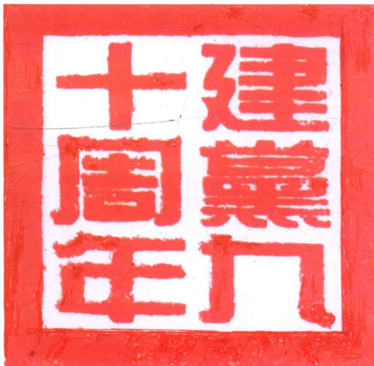
白云石玉中国印 文文收藏