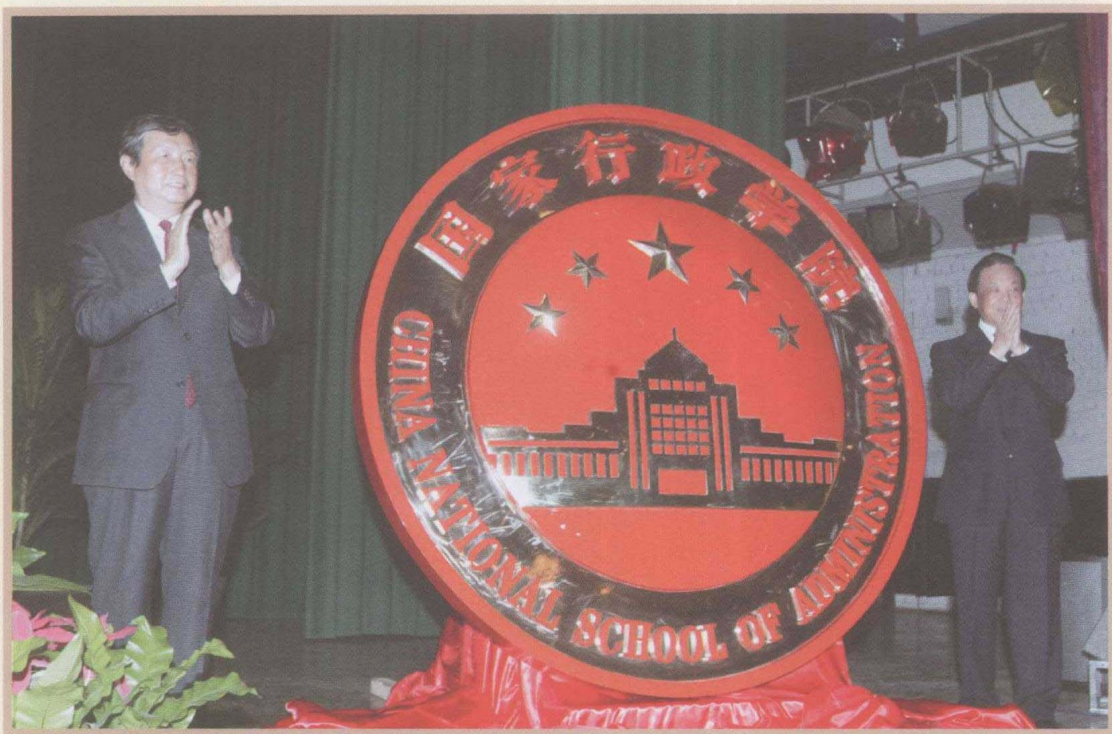
2009年9月2日，时任国务委员兼国务院秘书长、国家行政学院院长马凯与魏礼群出席开学典礼和国家行政学院院徽启用仪式。