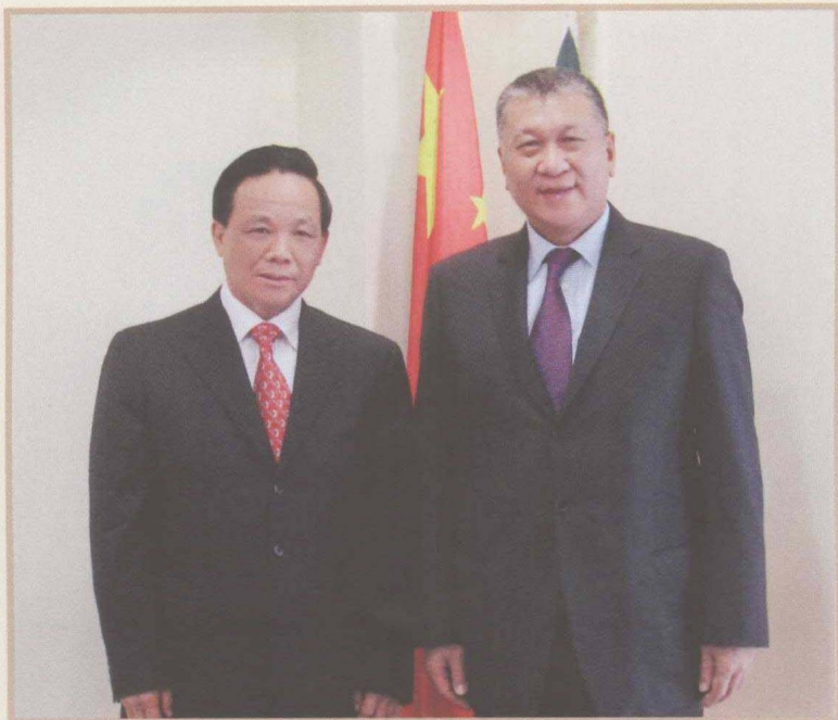
2009年4月21日，魏礼群访问澳门，与时任澳门特别行政区行政长官何厚铨合影。