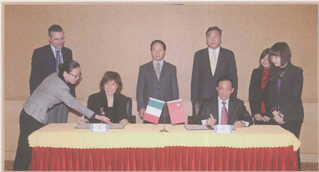
2010年11月10日，魏礼群与国际行政院校联合会主席特尔米妮签署国家行政学院与意大利政府领导力促进委员会、国家行政学院与意大利罗马第三大学的交流与合作备忘录。