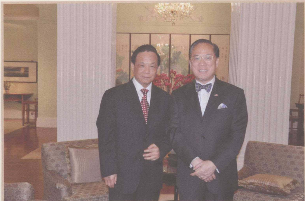
2010年5月27日，魏礼群访问香港，与时任香港特别行政区行政长官曾荫权合影。