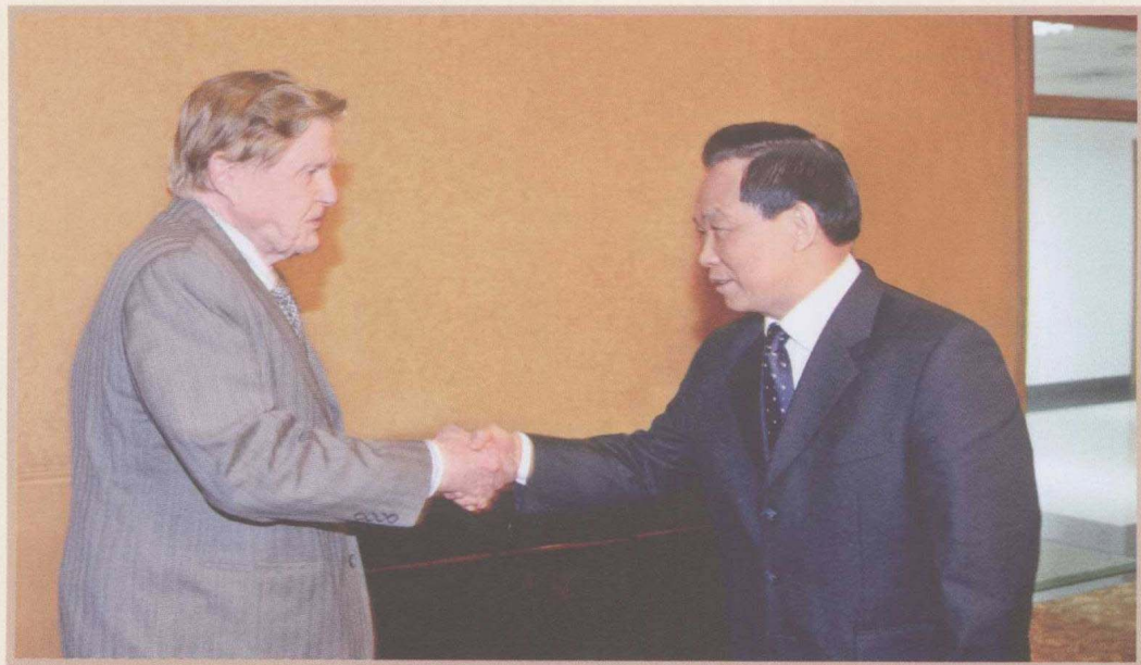
2010年5月13日，魏礼群会见应邀来国家行政学院就“中国的货币政策和世界货币体系”发表演讲的诺贝尔经济学奖获得者、美国哥伦比亚大学教授罗伯特·蒙代尔。