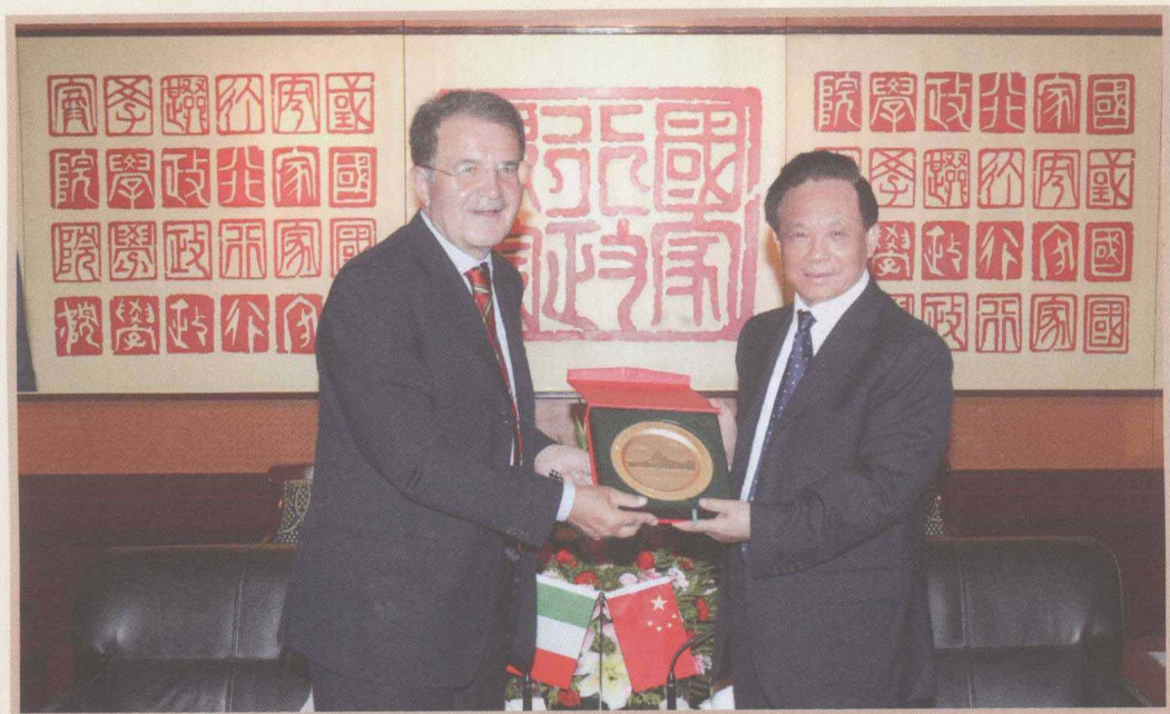
2009年7月2日，魏礼群会见来国家行政学院演讲的欧盟委员会前主席、意大利前总理罗马诺·普罗迪。