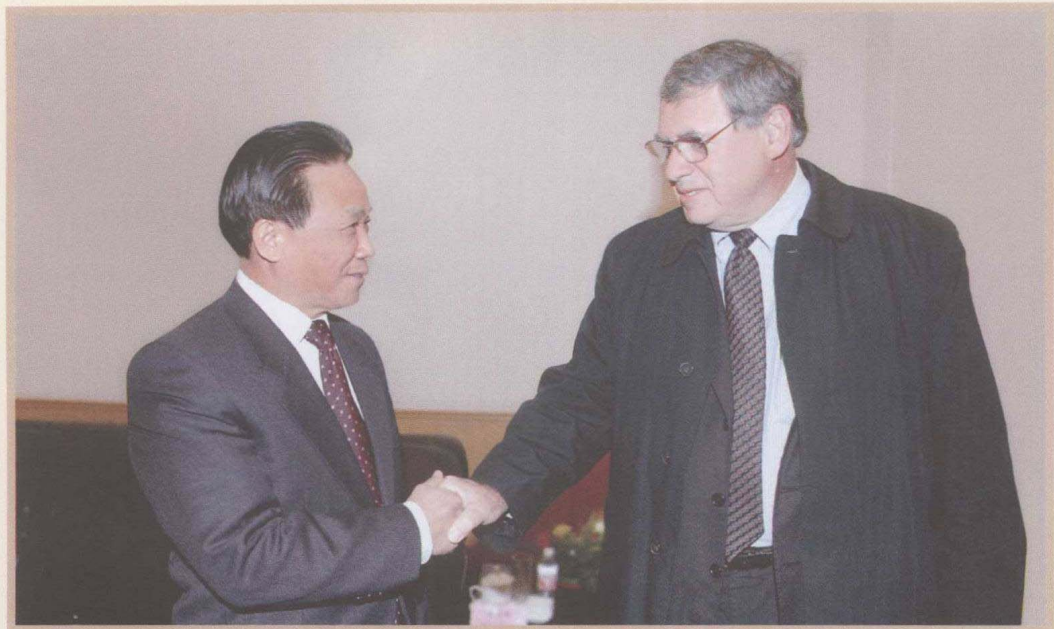
2008年11月17日，魏礼群会见来国家行政学院授课的国际行政院校联合会主席艾伦·罗森鲍姆。