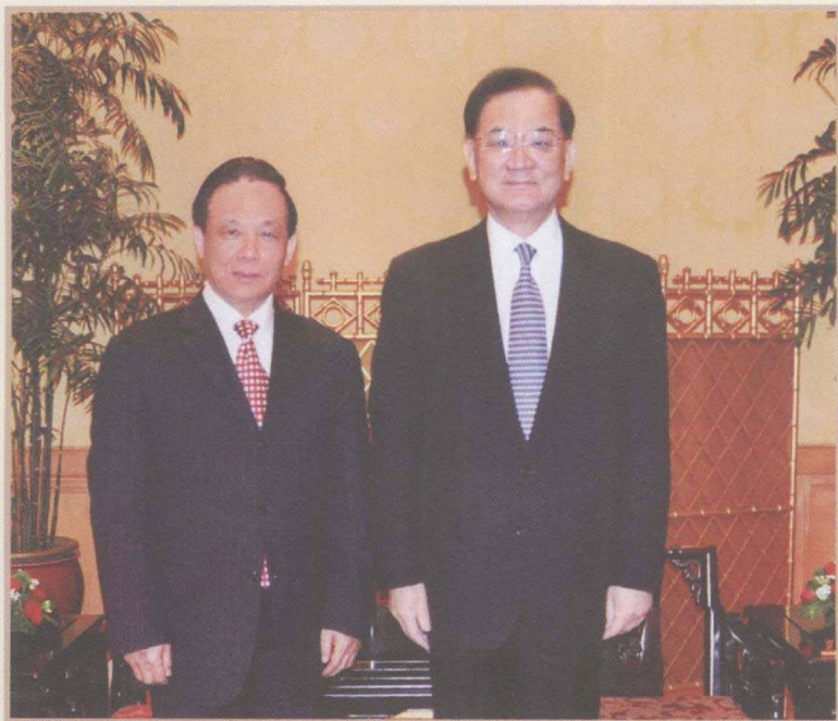
2010年6月3日，魏礼群访问台湾，与国民党荣誉主席连战合影。