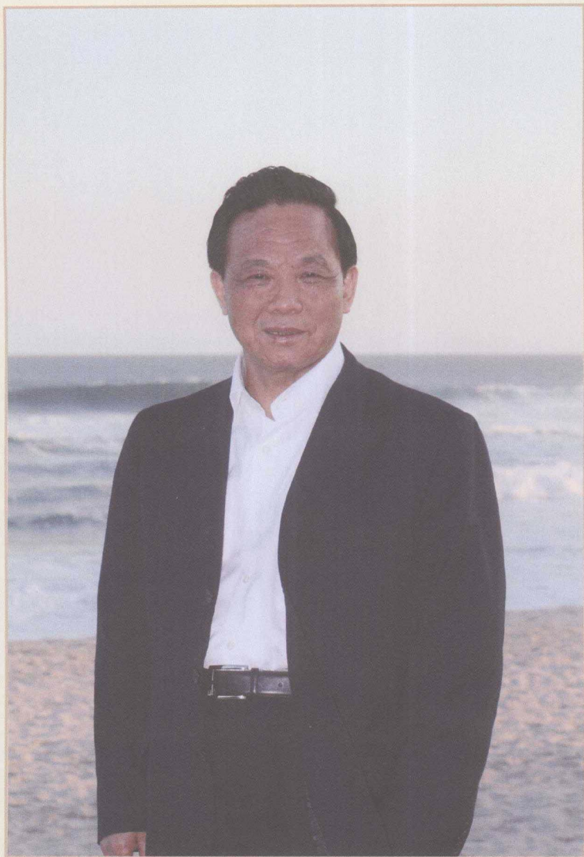
2009年8月6日，魏礼群率领国家行政学院代表团访问古巴时留影。