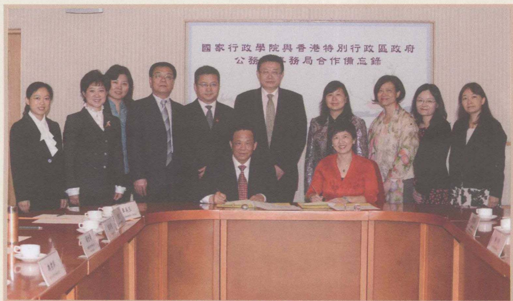
2010年5月27日，魏礼群与香港公务员局局长俞宗怡签署国家行政学院与香港特别行政区政府公务员事务局合作备忘录。