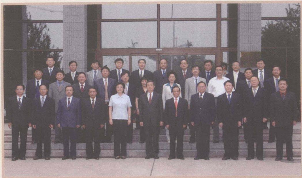
2009年9月2日，马凯与魏礼群出席国家行政学院秋季开学典礼并与受聘的兼职教师合影。