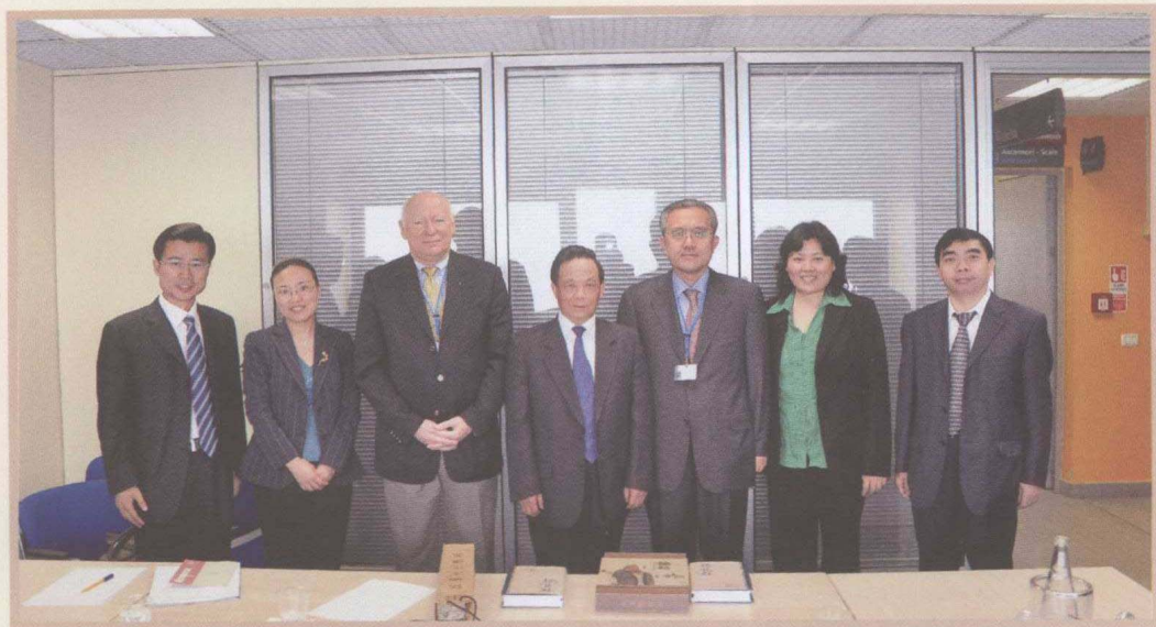
2011年6月14日，魏礼群出席在意大利召开的国际行政院校联合会会议期间，与国际行政科学学会主席金判锡（右三）、秘书长洛利坦（左三）会谈合影。