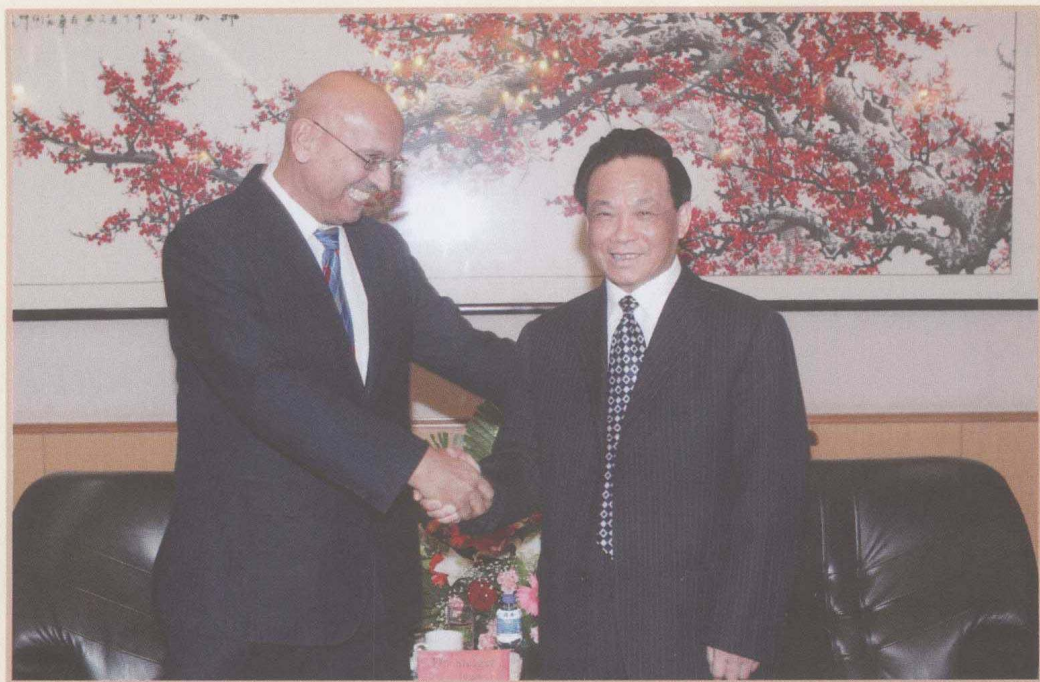
2009年9月30日，魏礼群会见德国技术合作公司副总代表施泰格。