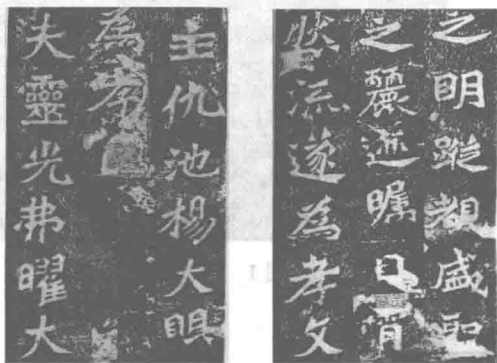
图2 杨大眼为孝文皇帝造像题记（局部）

造像题记是佛教文化的体现，南北朝至隋唐时期我国佛教空前兴盛，大量佛教徒捐资以造佛像，增加功德，消灾祈福。佛像刻于石窟之中或独立刻石，或一个或多个数量不等，有的还有佛龛。佛像姿态各异，神情有别。一般来说，佛像造成后，还要在佛像背部、佛龛侧面等处刻写题记，写出功德主的姓名、造像名称、出资造像的原因、求佛保佑的心愿，上为国君、社稷，下为自己的“七世父母”、已死去或仍健在家眷亲人等祈福，有的甚至愿“一切众生，咸蒙（或‘同’）斯福”，造像者或为一人，或同乡数十、数百人合造，都要一一署名，题记内容涉及当时的政治事件、历史人物、社会风俗、佛教宗派等广泛内容。单人造像的，比如《龙门二十品》中的《一弗为亡夫张元祖造像题记》，“太和廿年步罽郎张元祖不幸丧亡妻一弗为造像一区愿令亡夫直生佛国”，比较简单，仅仅30字；也可以夹叙夹议，文情并茂，例如《北海王元详造像题记》；或者辞藻华丽、对仗工整，比如《辅国将军杨大眼为孝文皇帝造像题记》，辞藻华美古奥，对仗讲究，应是文学高手撰文，该题记字形欹斜紧结，笔画茂密，刊刻精美，是典型的“魏碑书体”，应是专业匠人所为。