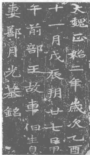
图3 车伯生息妻鄯月光砖志

摩崖石刻指将文字直接书写、刊刻在天然山石上，“刻石之特立者为之碣，天然者谓之摩崖”。 ① 先秦、秦代刻石多是碣，摩崖刻石兴起是在汉以后，特别是东汉以后，在北魏时期达到空前的高潮。摩崖刻石内容丰富，体例不一，有长篇铭文，诸如歌功颂德、宗教内容的文字，也有题记、题名、诗词联语、格言警句之类。北魏的摩崖石刻众多，著名的有《石门铭》、云峰山诸刻石等。