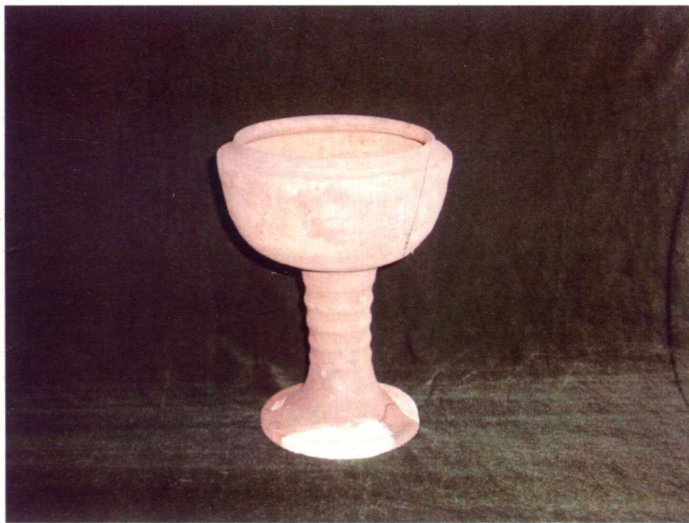
石门镇东阚各庄殷商遗址出土的陶豆

这些水井的发明，为促进农业经济发展起到了不可磨灭的作用。石门地区的农业按地貌及作物类型大致分为两个类型，一是平原稻、麦一年一熟及两年熟杂粮亚区，二是丘陵薯、粮一年一熟杂粮亚区。商周之际，石门境内有粟、稷、菽、粱等作物，西汉以后，作物品种日渐增多，有谷子、黍子、高粱、苏子等。到了北齐时期，又有稻米引进。据《卢龙县志》