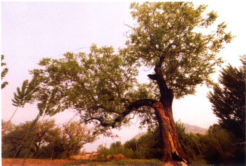
明代栽植的核桃古树

常邀文人雅士来此做客，自己写了不少吟诵钓台的诗歌，例如“结榭青山里，栖迟得自由。困来眠小榻，兴到驾轻舟。事业惭鸣凤，生涯叹拙鸠。尘缨何处濯，台下有清流。”“华