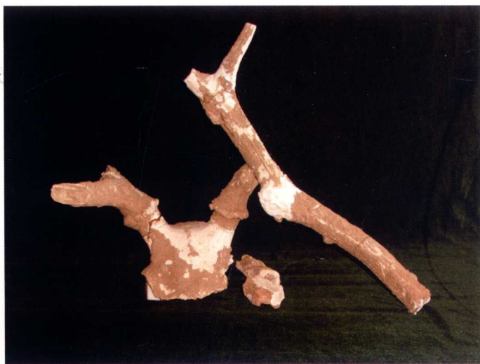
武山古人类遗址出土的大角鹿头骨化石

石门所在地交通发达，自古乃兵家必争之地，战略地位尤其重要，因此在历史上导致这片区域战争频繁。京哈铁路清光绪二十二年（1896年）建成通车后，自朱各庄车站东2.5公里处入境，经石门，至九龙山西铁路桥出境，长12公里，更增加了其地理位置的重要性。民国13年（1924年）9月17日，第二次直奉战争爆发。直系军阀冯玉祥倒戈反直，所部改为国民军，直奉军曾激战于蛤泊、石门一带，以奉军获胜告终。在民国31年（1942年），八路军十二团一部来滦东武装开辟根据地。张小川率迁滦卢县支队开始在石门、杨黄岭一