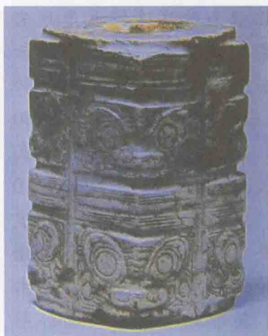
草鞋山遗址出土的玉琮

玉琮是新石器时代良渚文化的典型器物,表面纹线、纹饰精雕细琢,精美绝伦,极具艺术魅力。作为原始社会人们祭祀活动的重要礼器,玉琮还与财富、权力相联系,因而具有重要的历史价值。