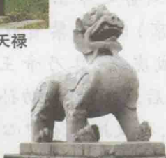
陈文帝永宁陵麒麟