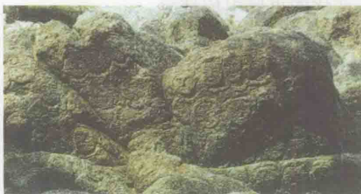
连云港孔望山摩崖造像

我国东部沿海地区惟一的新石器时代遗址。岩画以敲凿、磨刻等手法刻于长22米、宽15米的平整黑亮岩石上。其内容分为三组,有人面、农作物、鸟兽、日、月、星、云等图案以及各种符号,大多与图腾有关。琢痕深约1厘米,线条粗率劲直,形象生动。将军崖岩画是迄今为止发现的惟一反映我国原始社会农业部落生活的石刻岩画。