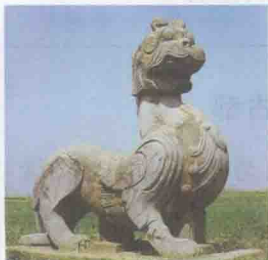
齐武帝景安陵天禄