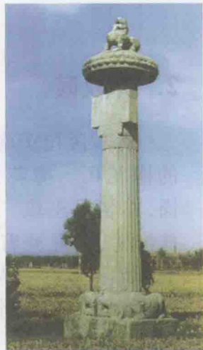
梁吴平忠侯萧景墓神道石柱

南朝指420—589年间建都南京的宋、齐、梁、陈4个朝代。在长达170余年的时间里,南朝皇帝在南京及附近的丹阳、句容等地营建了30多座帝王陵寝。南朝第一座陵墓是宋武帝的初宁陵。遍及各处的南朝陵墓呈现出独特的形制,通常陵墓前有石兽、神道石柱和石碑各一对。帝陵前的石兽为天禄和麒麟,王侯墓前则为石辟邪。神道柱由柱础、柱身和柱首组成,柱础下层为一刻有浮雕的方石,上层雕刻口内含珠的有翼怪兽。柱身上部嵌一方形小神道碑。柱首为莲宝盖,其上立一辟邪小石兽。石碑的碑座为一龟趺,碑首为圆形,双龙交缠环缀于碑脊,碑身刻有文字。南朝陵墓虽不起坟,但其石刻雄伟华丽,具有浓郁的时代气息,与同时代的北朝石刻交相辉映,在中国石雕艺术史上具有极其重要的意义。