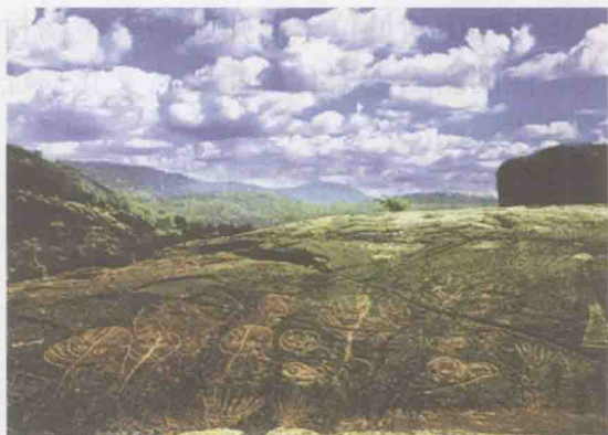
连云港将军崖岩画

远古文化遗址是多种多样的,除了居住地遗迹以及生产工具、生活物品、饰品遗迹外,还有一些镌刻或雕塑在石崖上以艺术品的形式保存下来的遗迹。连云港锦屏山将军崖岩画就是其中的佼佼者。它位于连云港市西南郊锦屏山马耳峰南麓将军崖海拔20米处,是目前已知的