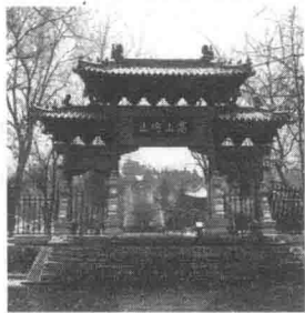
嵩阳书院一高山仰止牌坊

相传，杨时、游酢来到嵩阳书院拜见程颐，但是正遇上程老先生睡觉。这时，外面开始下起鹅毛大雪。二人求师心切，便恭恭敬敬地侍立门外，不言不动，静候着老师醒来。如此等了大半天，程颐才慢慢睁开眼睛，见杨时、游酢仍然站在门前，不禁大吃一惊。这时门外的雪已经积了一尺多厚了，而杨时和游酢并没有一丝疲倦和不耐烦的神情。深受感动的程颐便倾尽自己心力将所学全部传授给这两位虔诚的弟子。