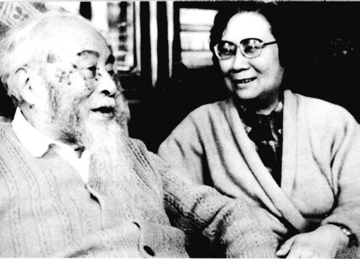
冯友兰先生与女儿宗璞在三松堂书房