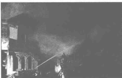
图 1.1 上海新天安堂失火

值取向、美学取向和创造能力,充当着历史见证者,同时它们本身也是历史真实组成部分,失之不可复得;但现实中往往未得到很好的保护与利用,造成了一些无法挽回的损失。例如,2007年1月,上海新天安堂失火受损,如图1.1所示。新天安堂是一幢建于1886年的哥特式教堂,其高耸的尖塔