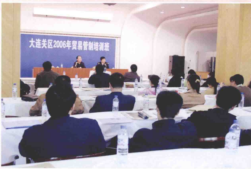
大连海关关区2006年贸易管制培训班