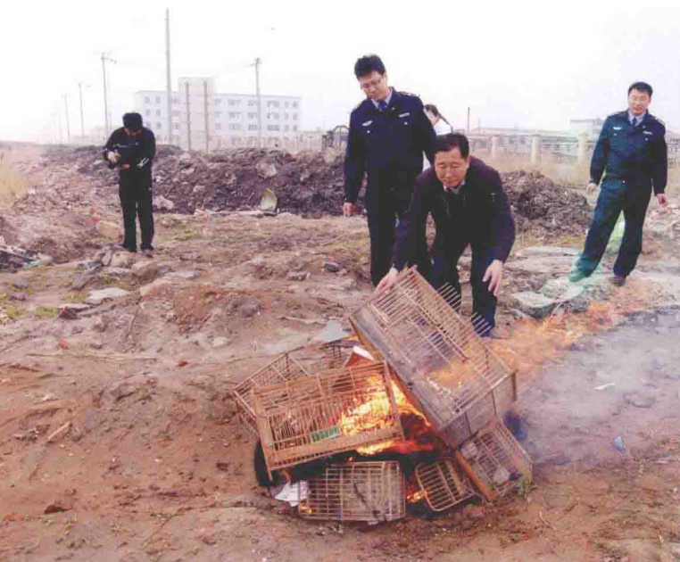
营口市在烧毁没收的鸟笼子、鸟网