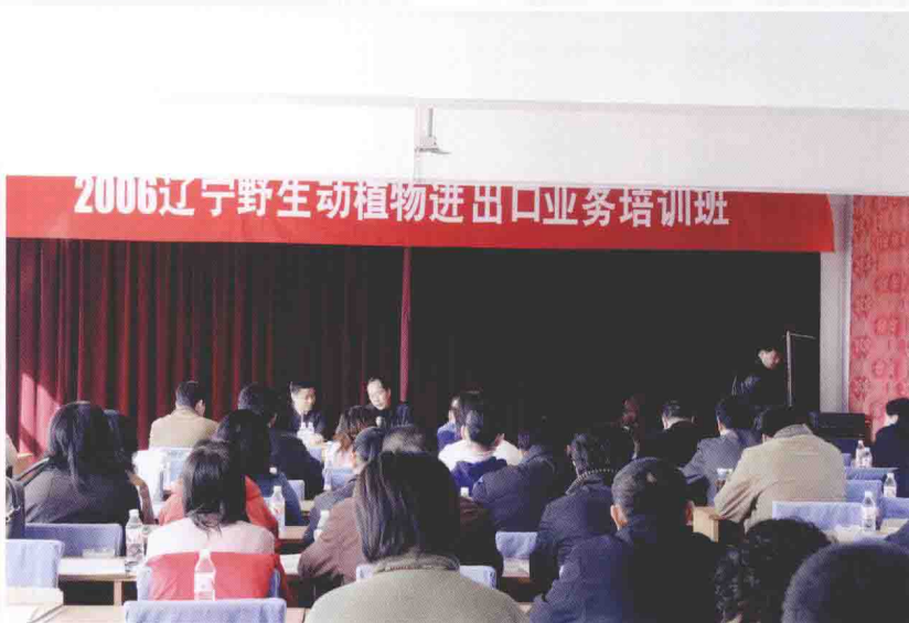
2006辽宁省野生动植物进出口业务培训班