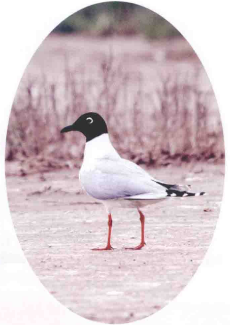
辽宁双台河口国家级自然保护区的黑嘴鸥