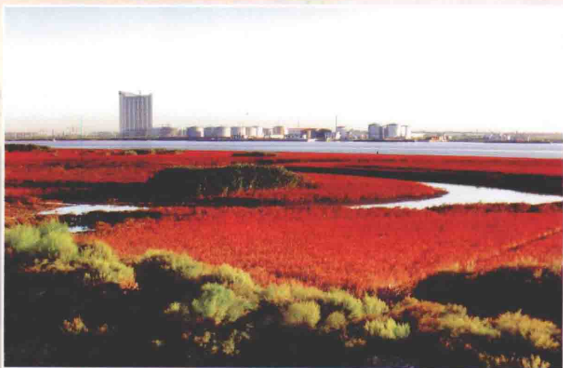
营口市永远角湿地