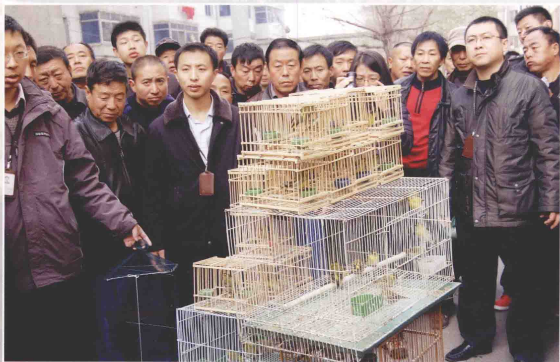
沈阳市鸟市执法没收的鸟笼子和鸟