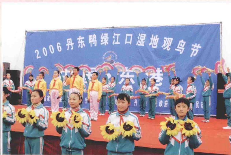
2006丹东鸭绿江口湿地观鸟节