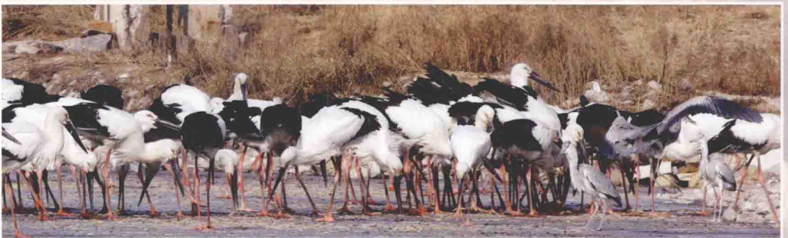
旅顺张家村东方白鹤