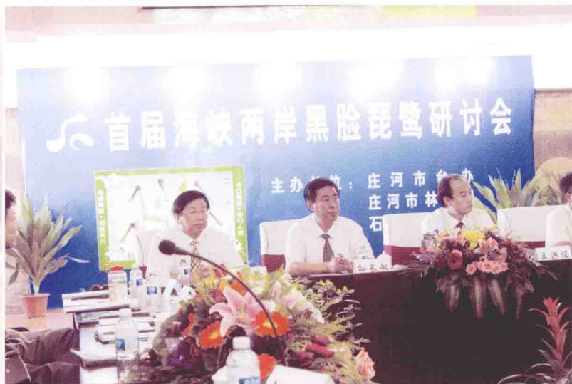
首届海峡两岸黑脸琵鹭研讨会