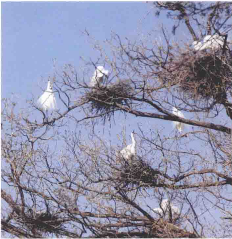
白鹭省级自然保护区