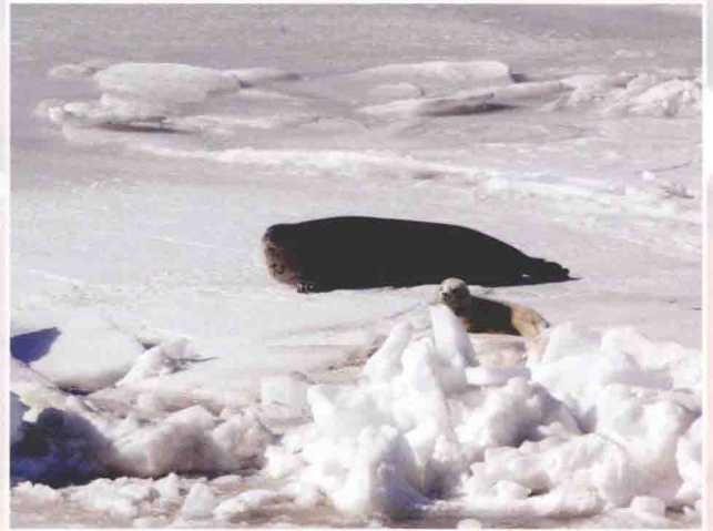
渤海斑海豹