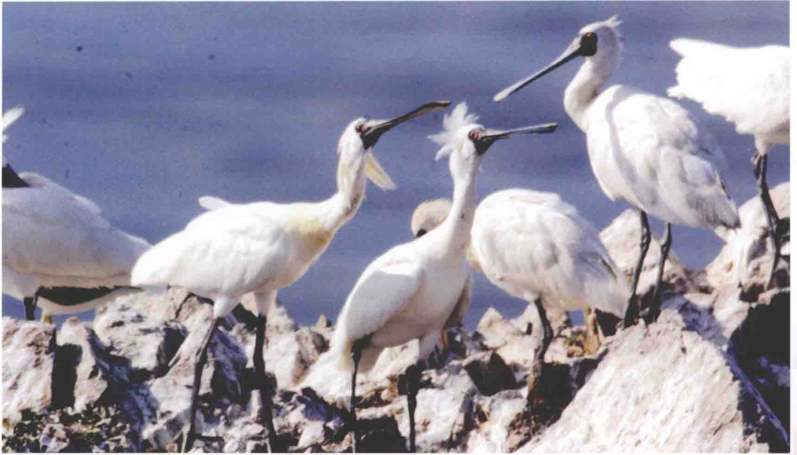
元宝坨子上的黑脸琵鹭