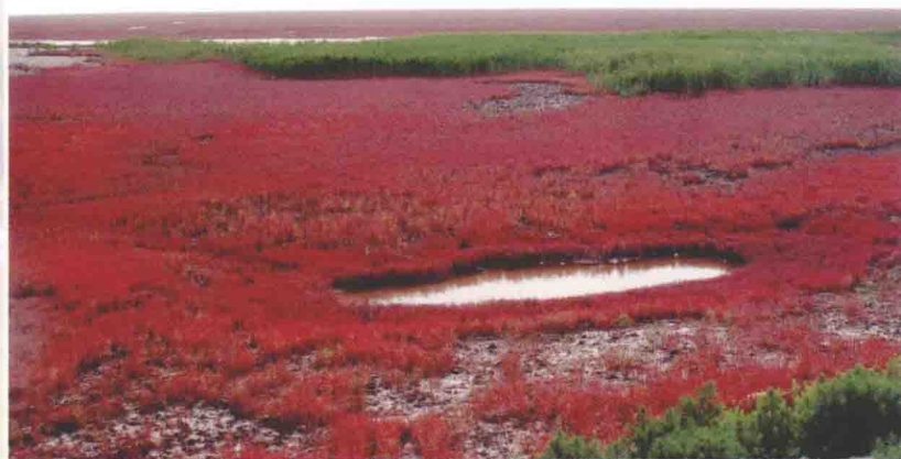
双台河口自然保护区的 碱蓬芦苇湿地