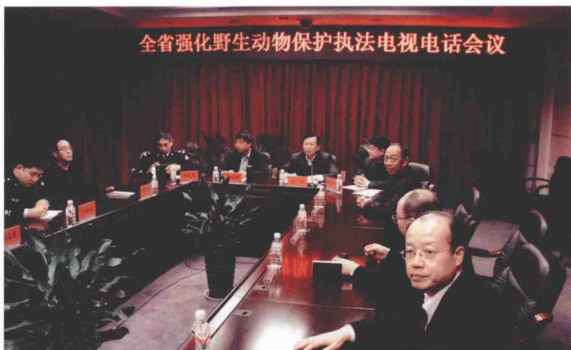
全省强化野生动物保护执法电视电话会议