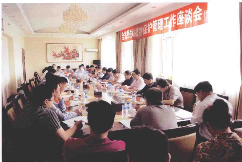
全省野生动植物保护管理工作座谈会