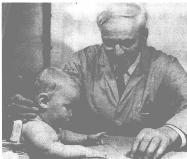
图 1.1 格赛尔双生子爬梯实验

在此过程中，主张遗传在学前儿童的发展中起重要作用的观点，把学前儿童的发展定义为受先天生物因素决定的过程，这些先天因素包括由遗传和基因突变所获得的生理结构、成熟水平、脑及其神经的反应特质等，如格赛尔的双生子爬梯实验（见图 1.1）证实了自然成熟在个体行为获得中具有重要作用；强调后天环境教育的观点则认为后天的环境因素，包括从微观到宏观的各层环境，如个体生长环境、家庭教养环境、社区环境、学校环境和同伴促进，社会价值与稳定性等，都是促使学前儿童心理和行为的生成、发展趋向完善的重要因素。今天，我们认识到遗传和环境对心理发展的影响是交互促进的过程：生物遗传因素对个体发展的潜在可能进行了限定，而环境教育条件则决定了个体在此范围内发展的现实水平，两者对儿童心理发展都有着重要的作用。