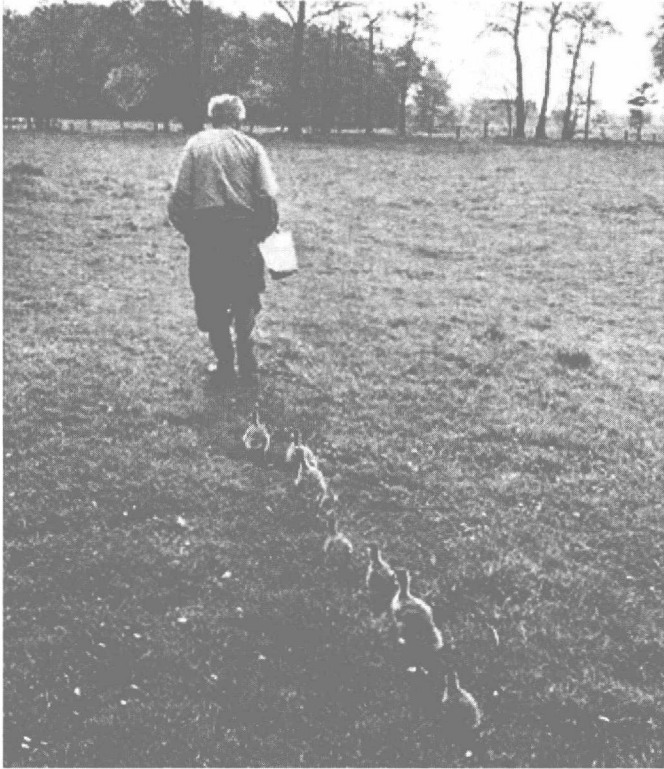
图 1.3 劳伦兹对于动物“印刻”现象的研究

儿童心理发展的“关键期”和“危机期”这两个概念最能体现儿童心理发展的不平衡性。著名的生态学家劳伦兹在研究小动物发育的过程中发现，刚出壳的小鹅会把它们出壳时几小时内看到的活动对象（人或其他东西）当作是母鹅，紧紧地跟随在其后面，即使以后母鹅出现，他们也不会跟随（见图 1.3）。这种仅在极为短暂的时间内发生，错过了这个时刻就不能发生的现象，劳伦兹将其称为“印刻”现象，这也是早期学者对“关键期”概念的研究。