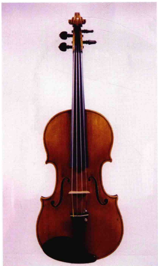
法国名琴“维尔昂”正面