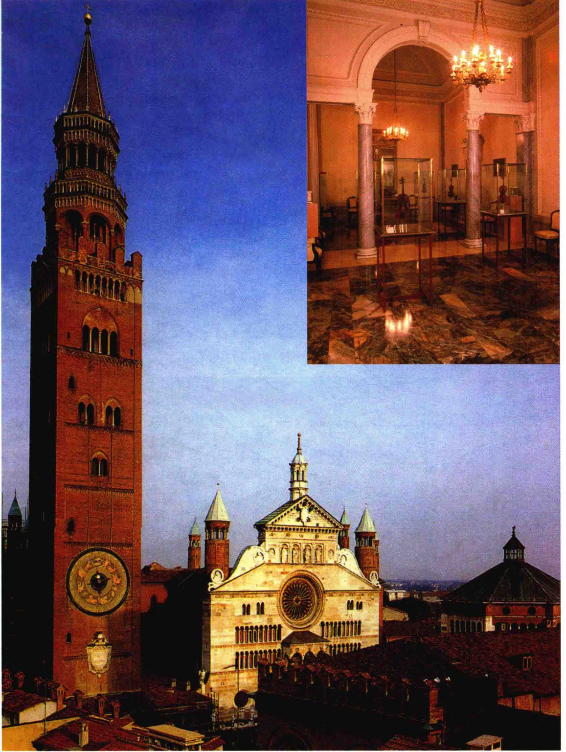
意大利克雷蒙那镇及克雷蒙那名琴陈列室