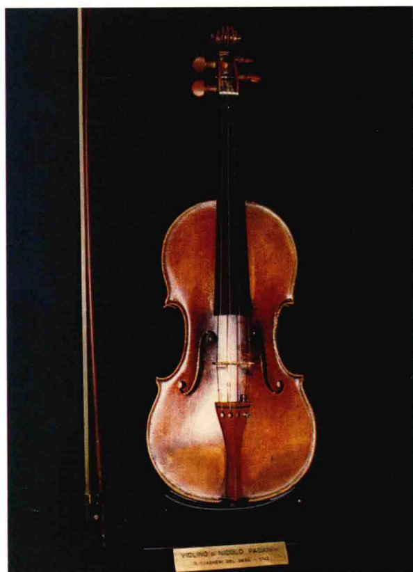
帕格尼尼用过的名琴“大炮”