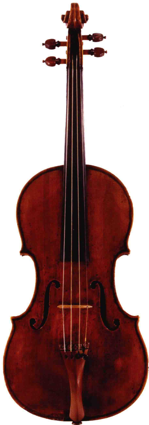
海菲兹用过的德·吉苏·瓜乃利于 1740 年制作的名琴“大卫”