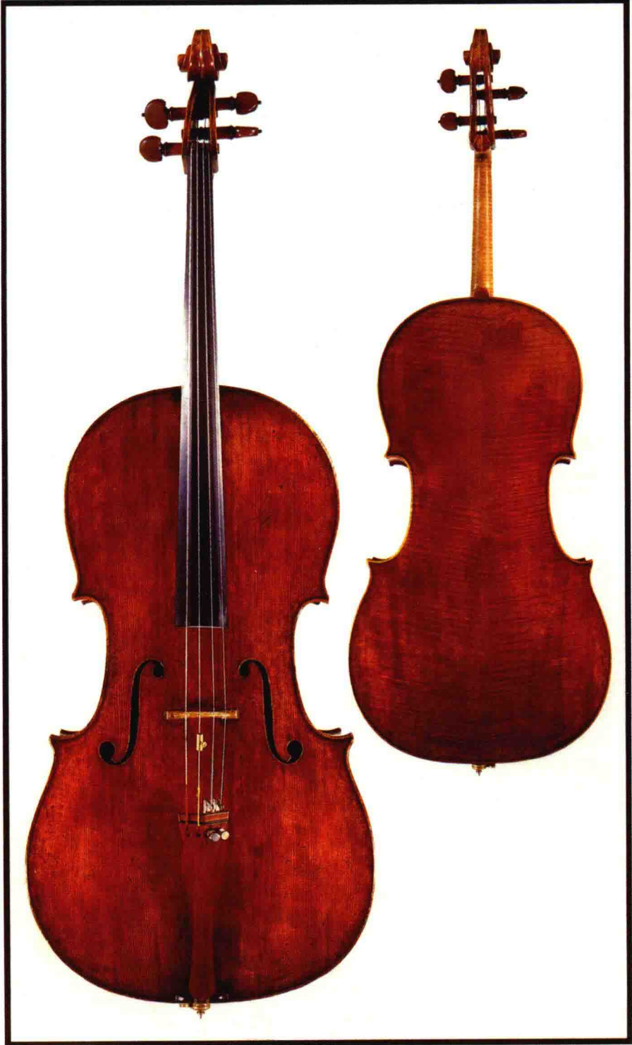
斯特拉地瓦利制作的大提琴