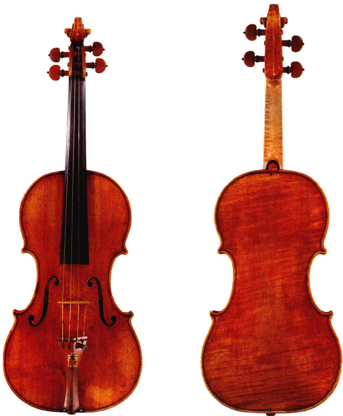
梅纽茵用过的名琴“威尔顿勋爵”