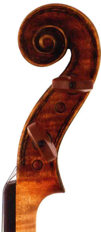
曹树堃先生制作的仿安德烈·阿马蒂名琴