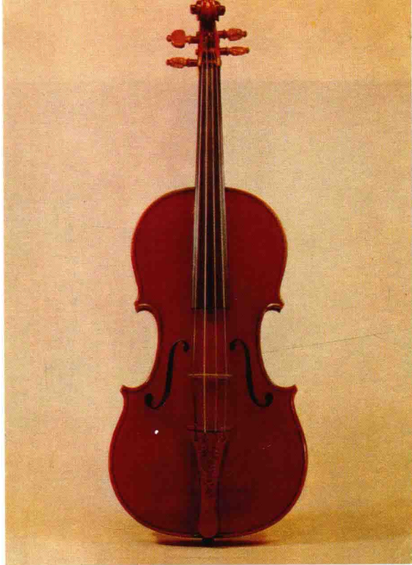
著名的斯特拉地瓦利名琴“弥赛亚”