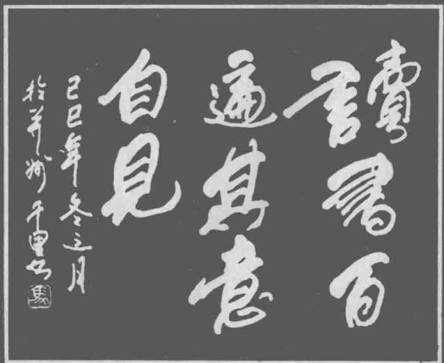
读书百遍 其意自见