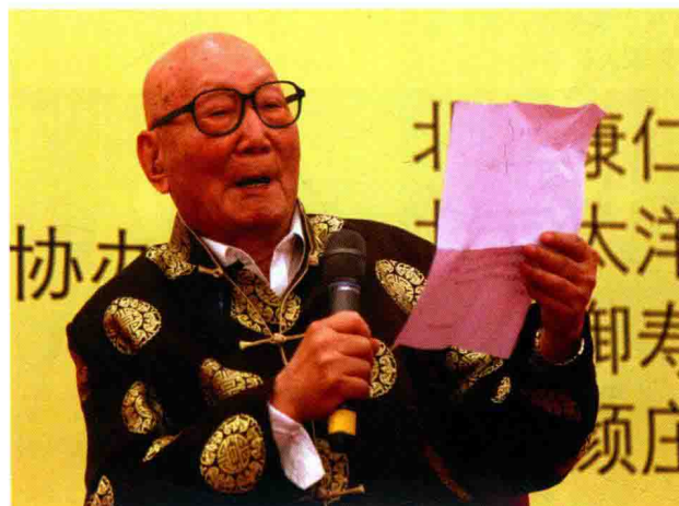
▲2012年10月颜正华教授于北京中医药大学向刘延东赠书