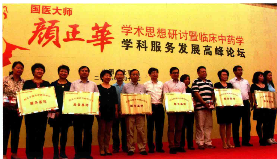
▲2015年9月国家中医药管理局人事教育司卢国慧司长、北京中医药大学徐安龙校长、北京市中医管理局禹震副局长为北京市颜正华临床中药学科服务基地授牌，并赠送《临床中药学科服务手册》系列数口袋书