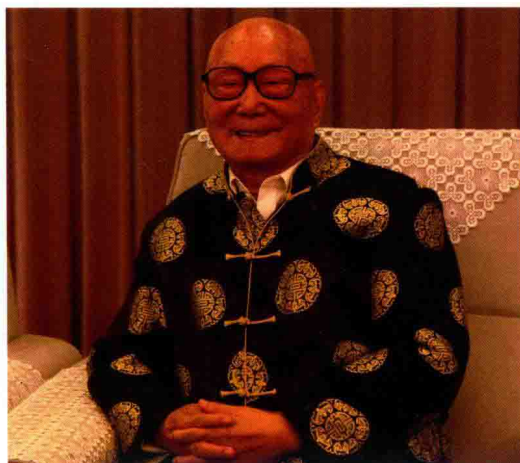
▲2015年9月颜正华教授于政协礼堂