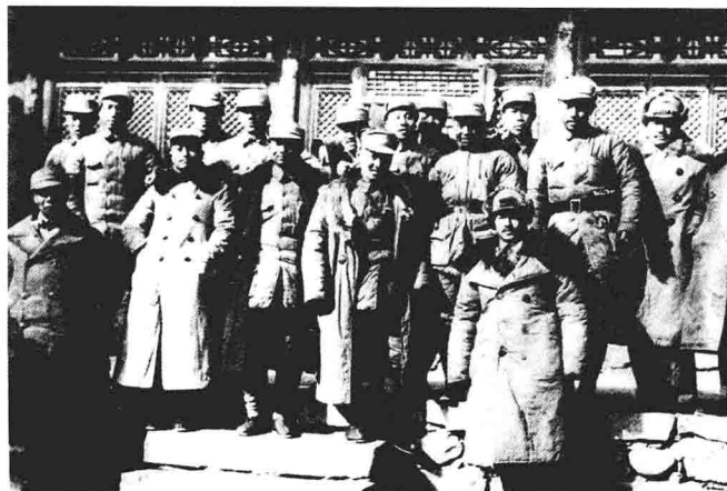
1940年2月，八路军一二〇师、晋西北党政机关、决死二纵队、四纵队、工卫旅、暂一师等部分领导人在兴县蔡家崖合影。后排右起：滕代远、贺龙、林枫、周士第、韩钧、侯俊岩、甘泗淇、李力果、罗贵波、牛荫冠、刘俊秀；前排左起：续范亭、雷任民、张文昂、赵林、关向应。