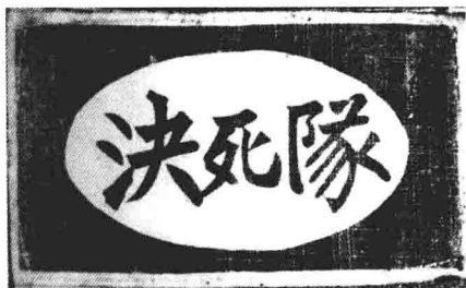
山西青年抗敌决死队臂章。

中共山西公开工作委员会书记，山西新军的创建者、组织者和领导者，决死第一纵队政治委员薄一波，1939年1月在山西沁县。