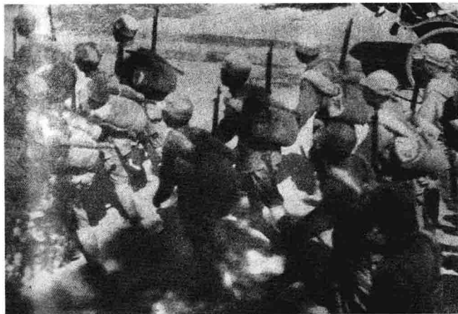
少年先锋队在开赴前线。