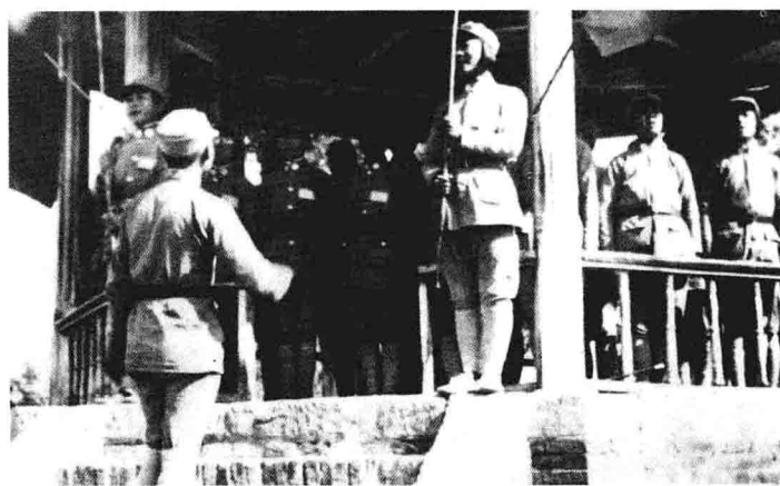
新军女兵连学员在太原文瀛湖五角亭高唱抗日救亡歌曲,进行抗日宣传。