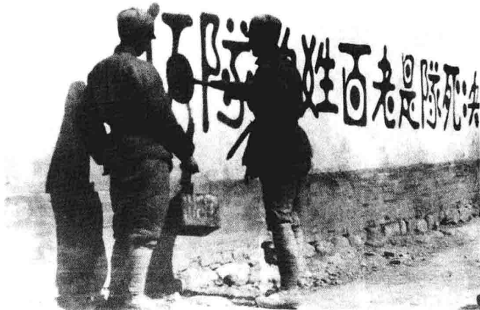
新军决死队战士在书写宣传标语。