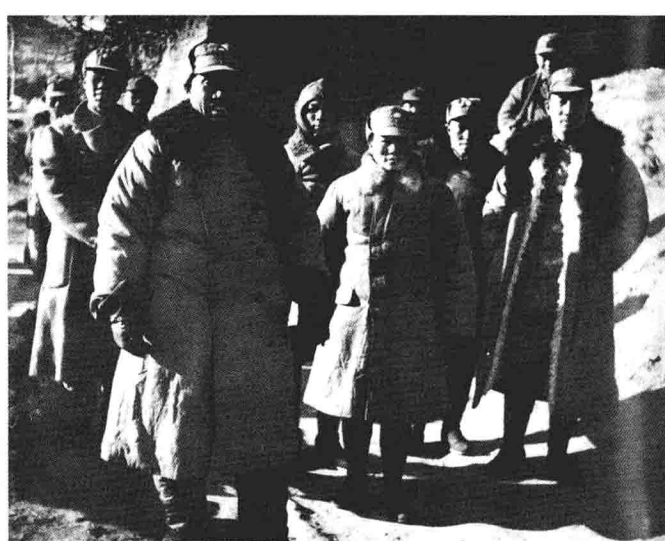
1939年元月，朱德总司令在决死一纵队政委薄一波、决死三纵队政委戎伍胜等陪同下，到沁县南沟村视察工作。前排左起分别为朱德、康克清、戎伍胜、薄一波。

1940年1月，决死二纵队、四纵队和暂一师部分领导人在临县粉碎“十二月事变”祝捷大会上合影。前排左起：张文昂、雷任民、李林（女）、金少英；二排左起：张国声、罗贵波、苏谦益；三排左二起：续范亭、顾永田。