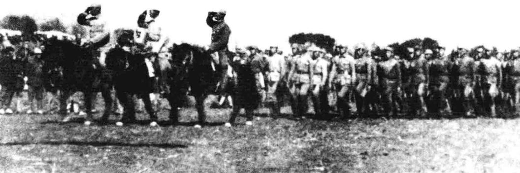
1938年8月，新军决死一纵队举行成立一周年大会，图为在纪念大会上举行阅兵式。