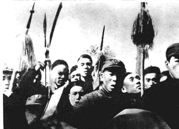
人民武装抗日自卫队。