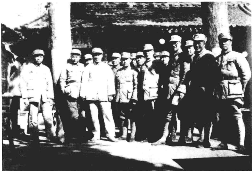
1938年3月，朱德总司令和八路军、新军决死队部分领导在晋东南沁县的合影。左一为彭德怀，左二为徐海东，左三为李达，左四为朱德，左十一为薄一波，左十二为朱瑞，左十三为张浩，左十四为刘伯承，左十五为左权。