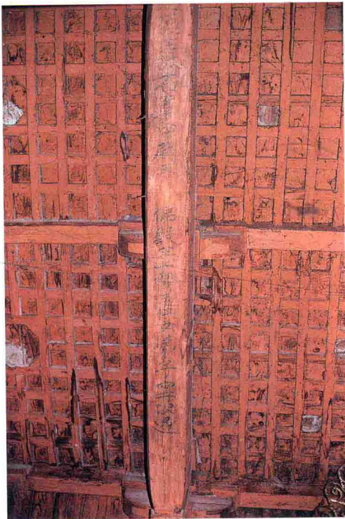
图1-2 东大殿梁底题迹

佛光寺东大殿梁底题迹较多，其中之一为“佛殿主上都送供女弟子宁公遇”，与殿前唐大中十一年经幢有关宁公遇的刻文相互印证，是了解大殿修建情况的重要史料。