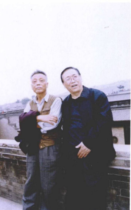
与老友温暖先生在一起