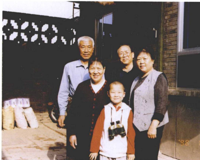
在平遥石青奇家相会