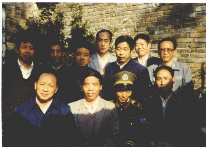
寓居长治的同学们