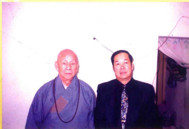
全国政协委员、中国佛教协会副会长根通大和尚（左）与作者合影