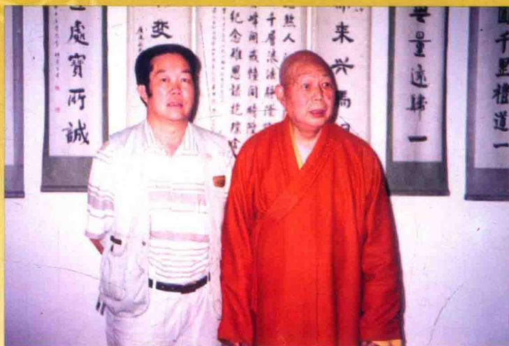
中国佛教协会会长释一诚大和尚与作者合影