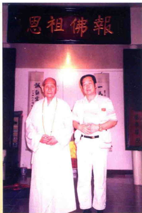
广东省佛教协会常务副会长佛源大和尚与作者合影