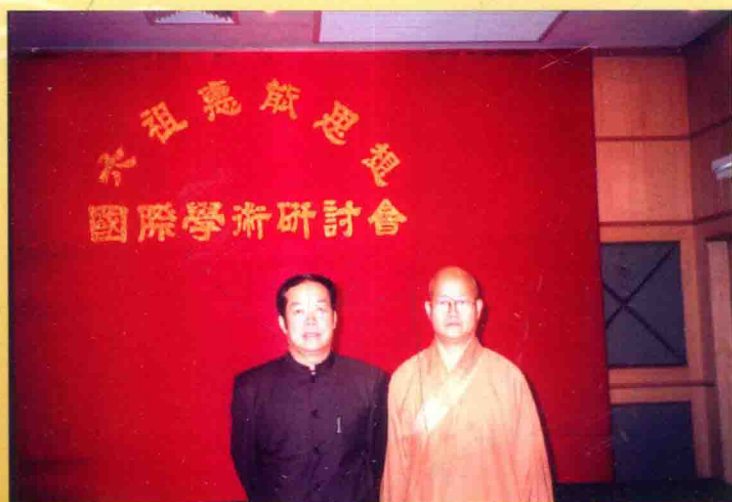
澳门佛教总会理事长释健钊大师（右）与作者合影