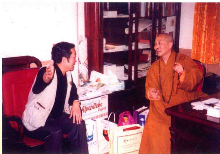
全国政协委员、中国佛教协会副会长、 普陀山主持释戒忍大和高与作者交谈