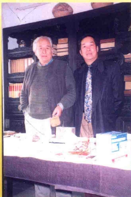
原中央美院院长侯一民（左）与作者合影