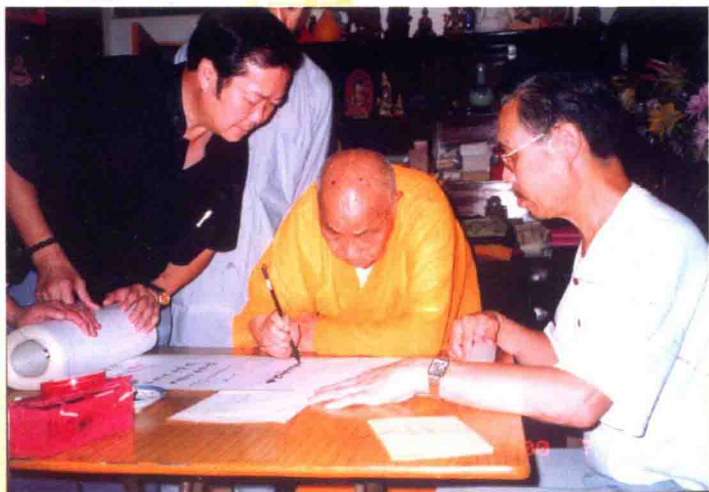
中国佛教协会咨议委员会主席九十八岁高龄的释本焕大和尚为作者的手抄《坛经》长卷题词