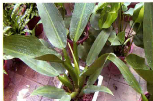
50. 立叶蔓绿绒 (泡泡蔓绿绒)