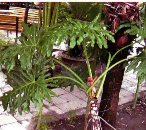
77. 羽裂蔓绿绒 (春芋)