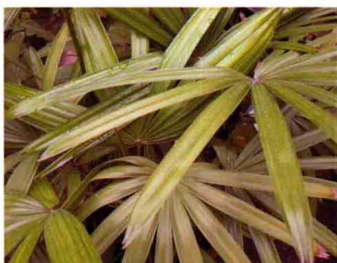
62. 棕 竹