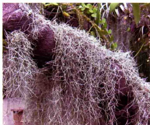
71. 松萝铁兰 (空气凤梨)