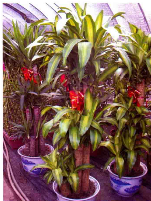
59. 香龙血树 (巴西木)