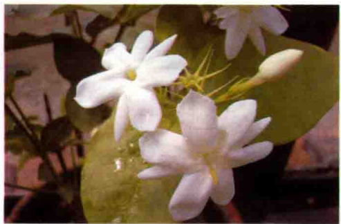
15. 茉 莉