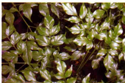
39. 菜豆树 (幸福树)