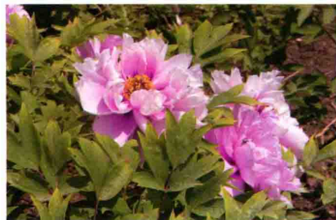
31. 夏季沈阳地栽的牡丹