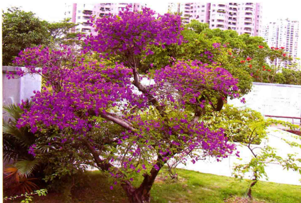
76. 长成乔木状的叶子花