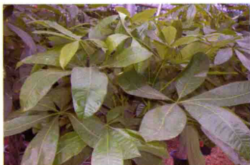
46. 瓜栗 (发财树)