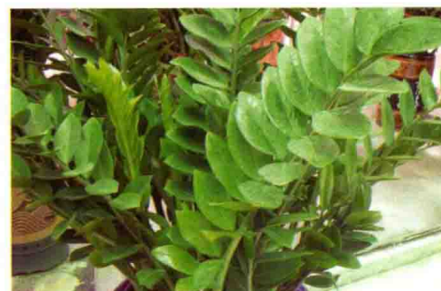
52. 美铁芋 (金钱树)