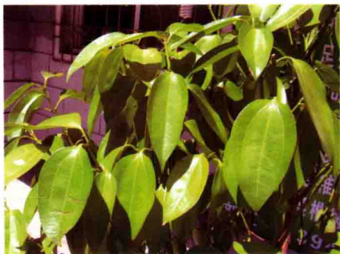
54. 肉桂 (平安树)