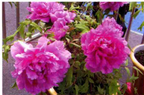
32. 深圳春节期间展出的洛阳牡丹