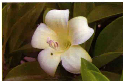
48. 华灰莉木 (非洲茉莉)