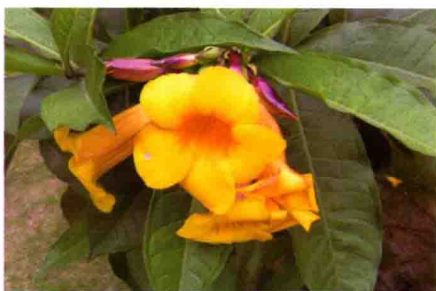
10. 黄 蝉