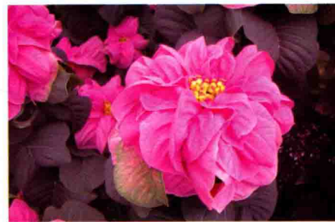
22. 重瓣一品粉 (品种名: 冬天粉玫瑰)