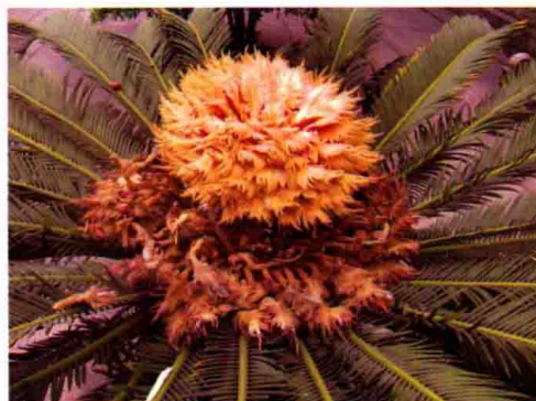
57. 雌性苏铁开花和结籽