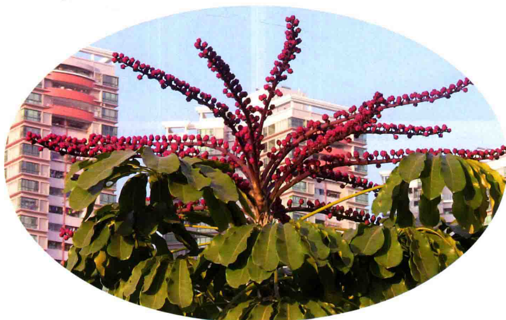
37. 澳洲鸭脚木 (大叶散)