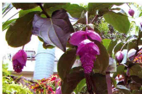
5. 粉苞酸脚杆 (宝莲灯)