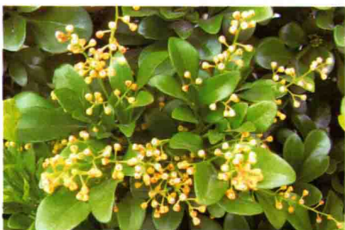
14. 米 兰