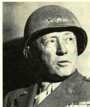
巴顿 | George Smith Patton

这次战役期间，第3集团军比美国历史上，或许是世界历史上的任何集团军都前进得更远，速度更快，并在较短的时间内投入了更多的兵力。只有如此出类拔萃的美国军官、士兵和装备才可能取得这样的战绩。没有一个国家能与这样的军队相抗衡。