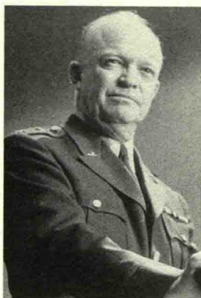
艾森豪威尔 | Dwight Eisenhower

美国陆军五星上将。第二次世界大战爆发后，历任副团长、师参谋长、军参谋长、集团军参谋长。1941年晋升为准将。1942年6月任欧洲战区美军司令。同年11月作为北非远征军司令，指挥实施北非登陆战役。1943年2月任地中海战区盟军司令。1943年12月任盟军远征军最高统帅。1944年任诺曼底登陆战役最高指挥官，同年12月晋升为陆军五星上将。