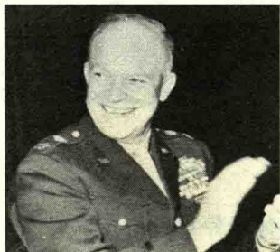
艾森豪威尔 | Dwight Eisenhower