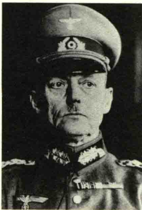
伦德施泰特 | Gerd von Rundstedt

美国陆军五星上将。第二次世界大战爆发后，历任副团长、师参谋长、军参谋长、集团军参谋长。1941年晋升为准将。1942年6月任欧洲战区美军司令。同年11月作为北非远征军司令，指挥实施北非登陆战役。1943年2月任地中海战区盟军司令。1943年12月任盟军远征军最高统帅。1944年任诺曼底登陆战役最高指挥官，同年12月晋升为陆军五星上将。