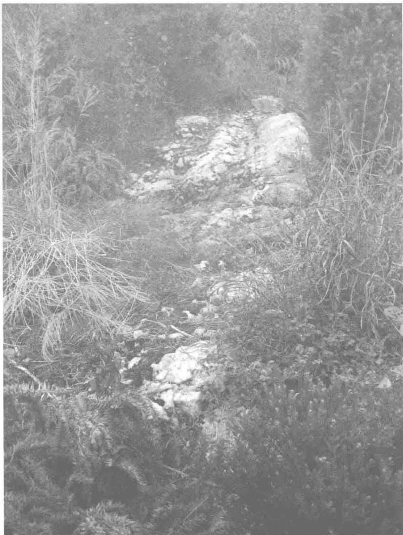
期思嶺山中石壁，稼軒開山所得，遂命名為蒼壁， 有《千年調》詞紀其事。