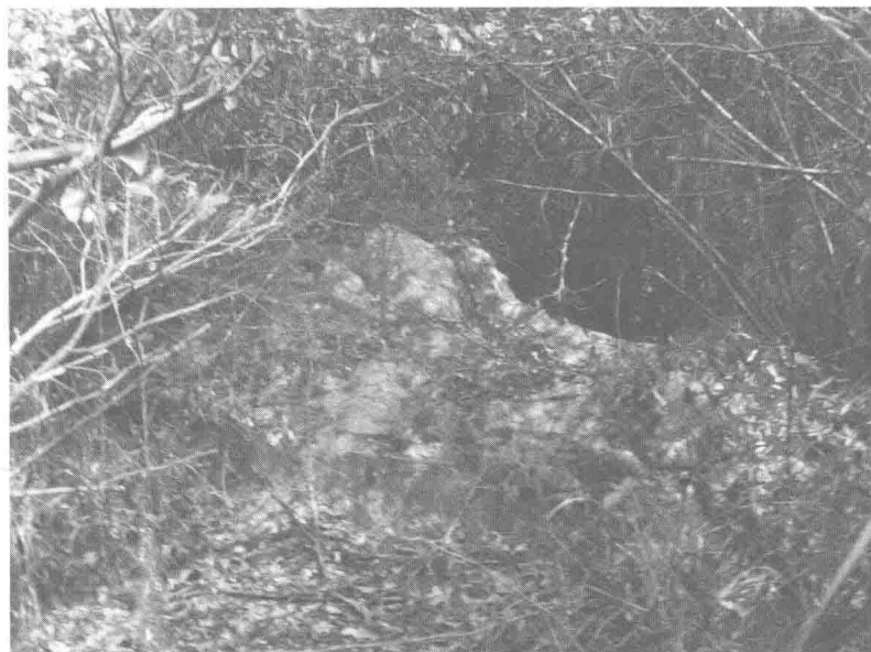
博山雨巖之下，有石浪長三十餘丈，稼軒命之曰山 鬼，爲賦《山鬼謠》詞紀之。