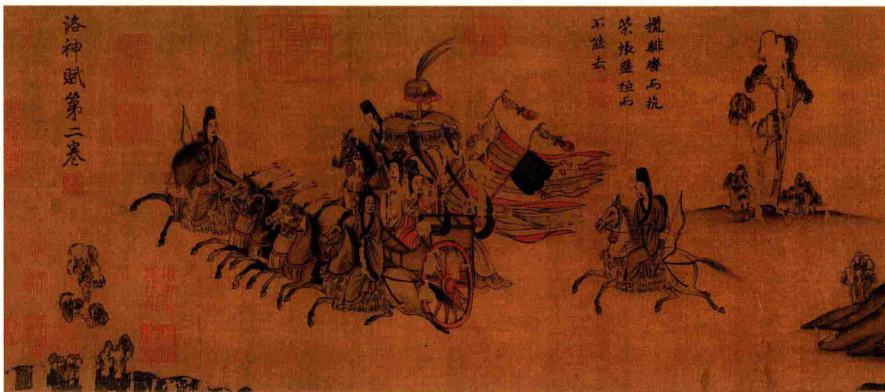
宋·佚名 摹顾恺之洛神赋图（局部） 纸本设色 辽宁省博物馆藏