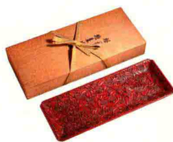
明·剔红风穿荔枝枝长盘