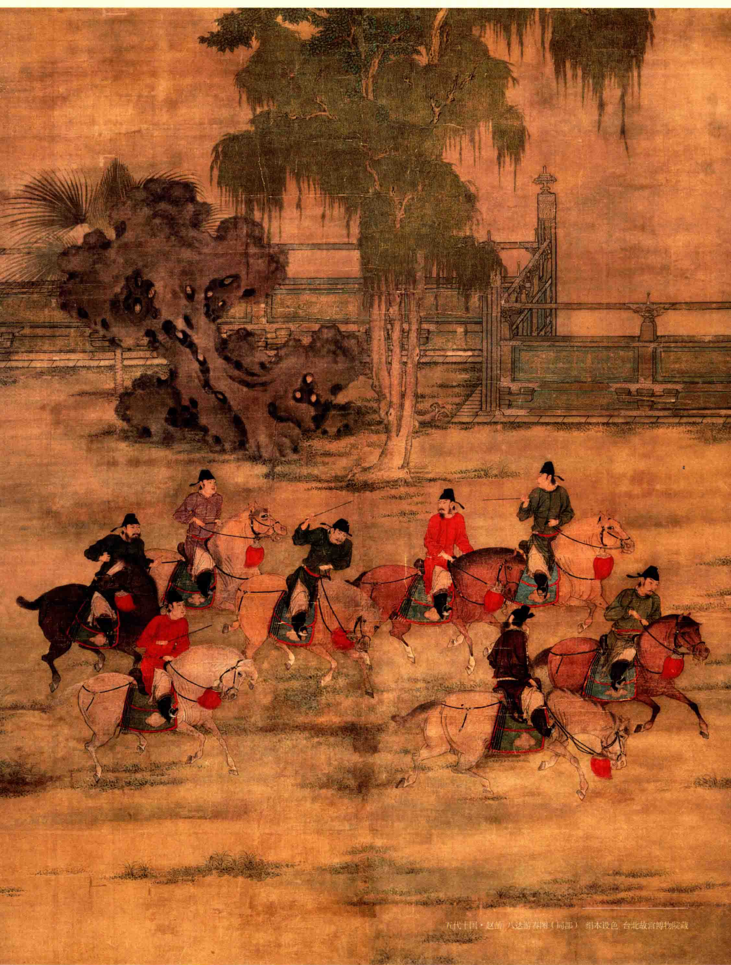
五代十国·赵喆 八达游春图(局部) 绢本设色 台北故宫博物院藏