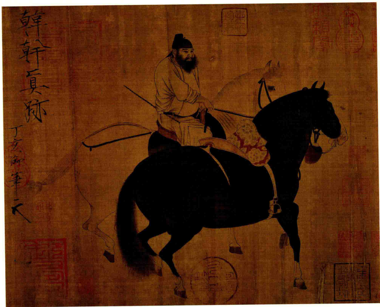
唐·韩幹 牧马图 27.5×34.1cm 绢本设色 台北故宫博物院藏

人马画家笔下的神骏更是形象地记录了这个时代的强音。唐代人马画家可分为两类，画风迥然有异，都对后世产生了范本作用。