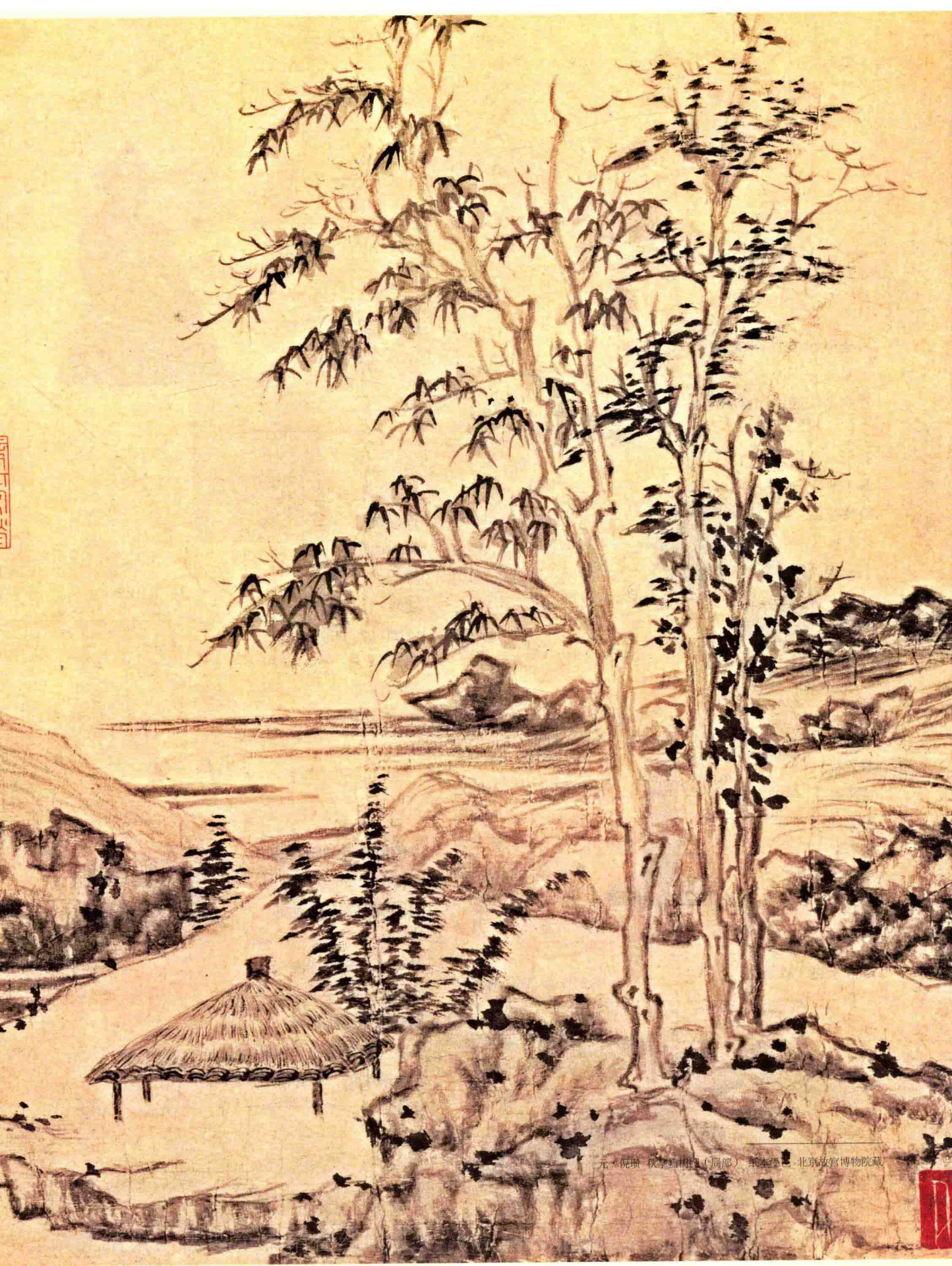
元·倪瓒 秋景图轴（局部） 纸本墨色 北京故宫博物院藏