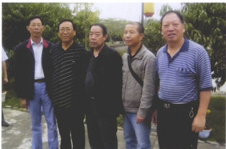
与贾平凹（中）等合影