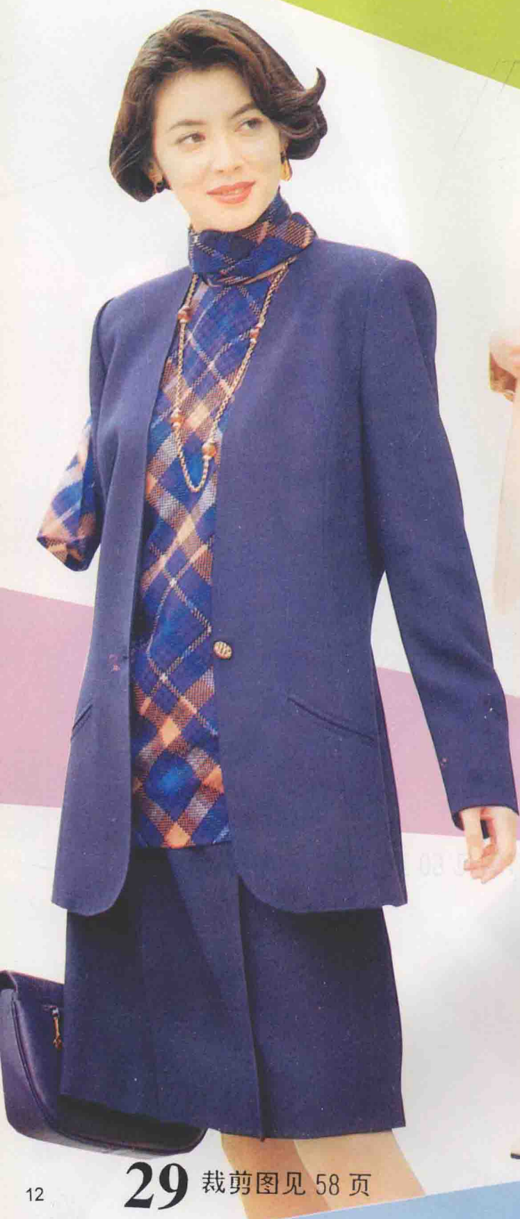
29 裁剪图见 58 页