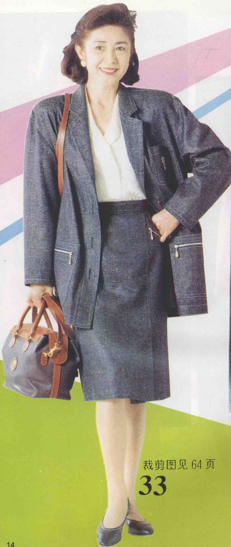
裁剪图见 64 页