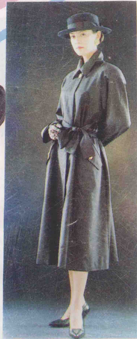
裁剪图见 65 页